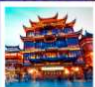
ตลาดร้อยปีฉิงหวงเป่ียว