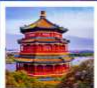
พระราชวังฤดูร้อนจิ๋นเหอหยวน