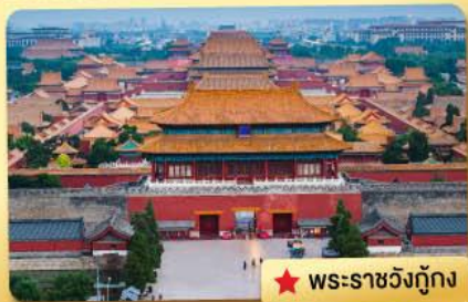
★ พระราชวังกู้กง