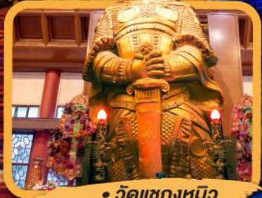
• วัดแซงหมิว