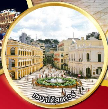
เวเนตัสแควอร์