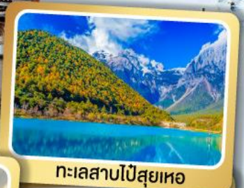
ทะเลสาบไป๋สือเหอ