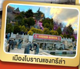
เมืองโบราณแชนกรีล่า