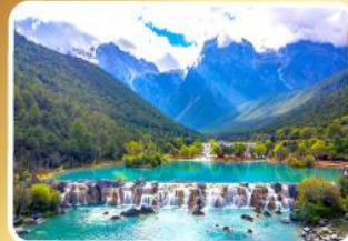
หุบเขาน้ำเงินทะเลสาบไป๋สฺยเหอ