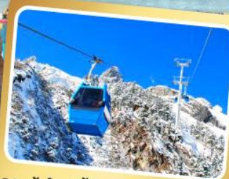
กระเช้าใหญ่ขึ้นภูเขาหิมะมังกรหยก