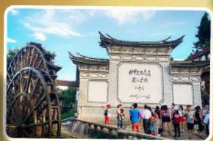
เมืองท่าลี่เจียง