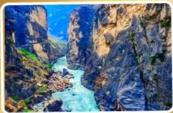
ช่องแคบเสีอกระโจน