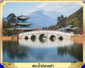
สะพานมังกรล่า