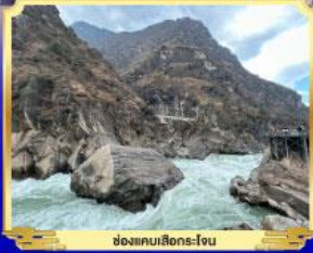
ช่องแคบเลิธอร์-โง