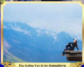
ร้าน Coffee Yun Di An วิวจุดชมวิว