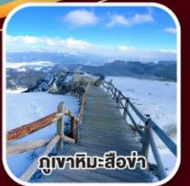
ภูเขาหิมะสีงา