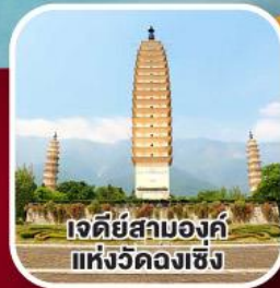
เจดีย์สามองค์ แห่งวัดหลงเซิง