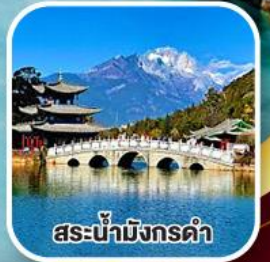
สะพานมังกรดำ