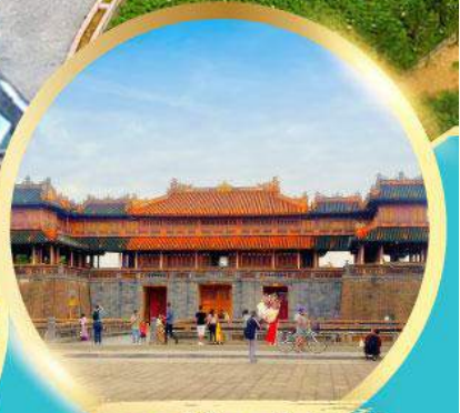
พระราชวังโบราณโคโคเญ