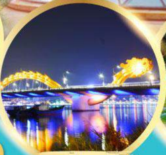
สะพานมังกรพันไฟ