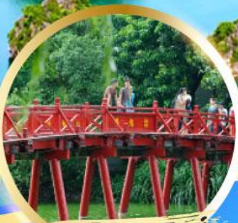
สะพานแสงอาทิตย์