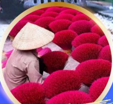
หมู่บ้านรูป Phu Cau