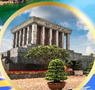
สุสานลุงโฮ