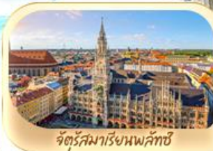
จัตุรัสมาเรียนพลาซซ