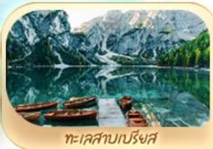
ทะเลสาบเบรียงส์