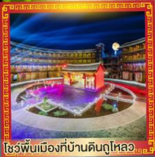
โชว์พื้นเมืองที่บ้านดินตุไหล่อ