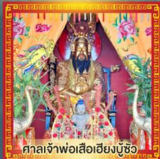
ศาลเจ้าพ่อเสือฮียงบู๊ซิว