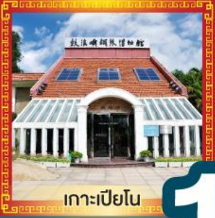
เกาะเปียวโน