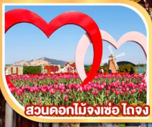
สวนดอกไม้จางเซ่อ ไถจง