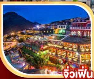
จีวเฟิ่น