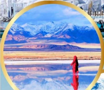
ทะเลสาบเกลือฉางซ่า