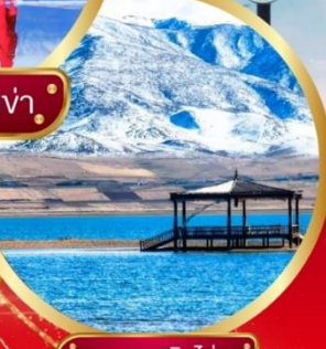
ทะเลสาบชิงไห่