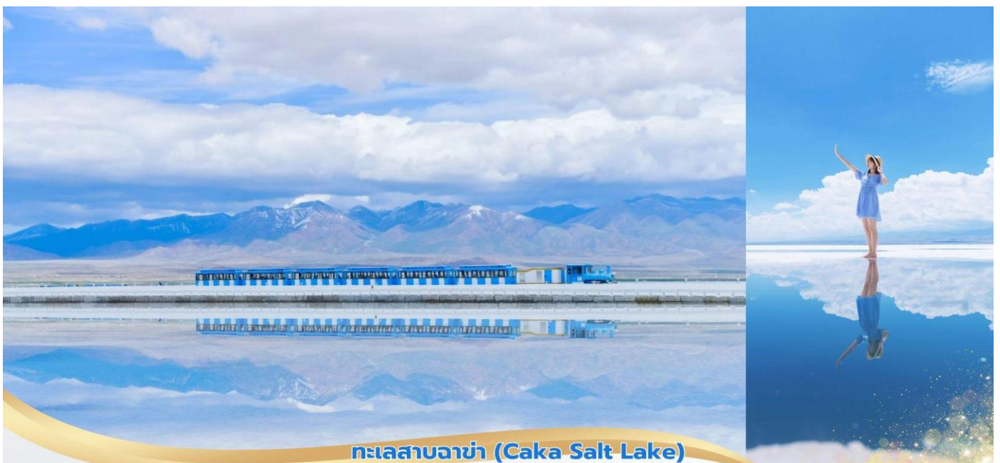
ทะเลสาบจาช่า (Caka Salt Lake)

พิเศษ... นั่งรถไฟเล็กชมวิวทะเลสาบ ชมความงามทะเลสาบปกคลุมด้วยคริสตัลเกลือสีขาวบริสุทธิ์ ในบางจุดยังสามารถเดินบนพื้นเกลือที่แข็งตัวได้อีกด้วย