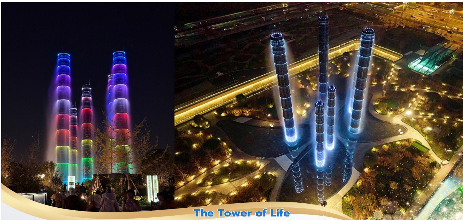
The Tower of Life

จากนั้นนำท่านเที่ยวชม ชอยกว้างชอยแคบ แหล่งท่องเที่ยวและจุดเช็คอินชื่อดังแห่งเมืองเจิ้งตู ที่นี้ประกอบด้วยสามชอยชื่อดัง คือ ชอยกว้าง ชอยแคบ และชอยบ่อน้ำ เดิมทีนี้เป็นย่านที่พักอาศัย ของชนเผ่าแมนจู ภายหลังได้กลายเป็นย่านการค้าขึ้นชื่อในสมัยราชวงศ์ชิง ที่นี้มีบ้านเรือนจีน โบราณมากมายที่ยังคงสภาพความสมบูรณ์ดึงดูดทั้งชาวพื้นเมืองและนักท่องเที่ยว นอกจากนั้น ยังมีร้านอาหาร ร้านกาแฟร้านจำหน่ายสินค้าพื้นเมือง และของที่ระลึกที่เหมาะกับการมาเที่ยวชม นำท่านอิสระเลือกช้อปปิ้ง ไอเท็มสุดฮิตที่ร้าน POP MART สายสะสมน้อง Labubu ไม่ควรมพลาด