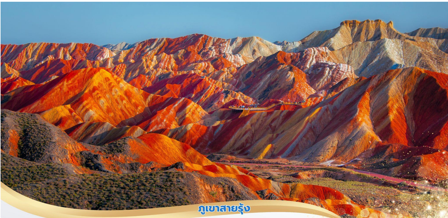
ภูเขาสายรุ้ง

นำ นำท่านเที่ยวชม อุทยานภูเขาสายรุ้ง (รวมรถกอล์ฟ) ในเขตอุทยานมีภูเขาหินทรายสีแดงที่เกิดจากการเคลื่อนตัวของเปลือกโลกที่กินเวลานานหลายร้อยล้านปี จนกลายเป็นลักษณะภูมิประเทศที่มีรูปปลักชันแปลกประหลาดและสีสันหลากหลายสายรุ้ง เป็นประติมากรรมทางธรรมชาติที่ยิ่งใหญ่ สวยงามเหมือนคำบรรยายพื้นที่อุทยานครอบคลุมพื้นที่ราว 300 ตารางกิโลเมตร ประกอบด้วยภูเขาหินทรายสีแดงสด และสีแดงน้ำตาลที่มีระดับความเข้มข้นของสีที่แตกต่างกันนับพันยอด นำท่านนั่งรถกอล์ฟของอุทยานแวะเที่ยวตามจุดชมวิวที่เป็นไฮไลต์สำคัญต่างๆ ในอุทยาน โดยในจุดชมวิวทุกจุดจะมีทางบันไดขึ้น ลงและระเบียงทางเดินเพื่อให้นักท่องเที่ยวสามารถเดินชม และถ่ายภาพได้อย่างสะดวก ปลอดภัย