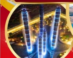
The Tower of Life