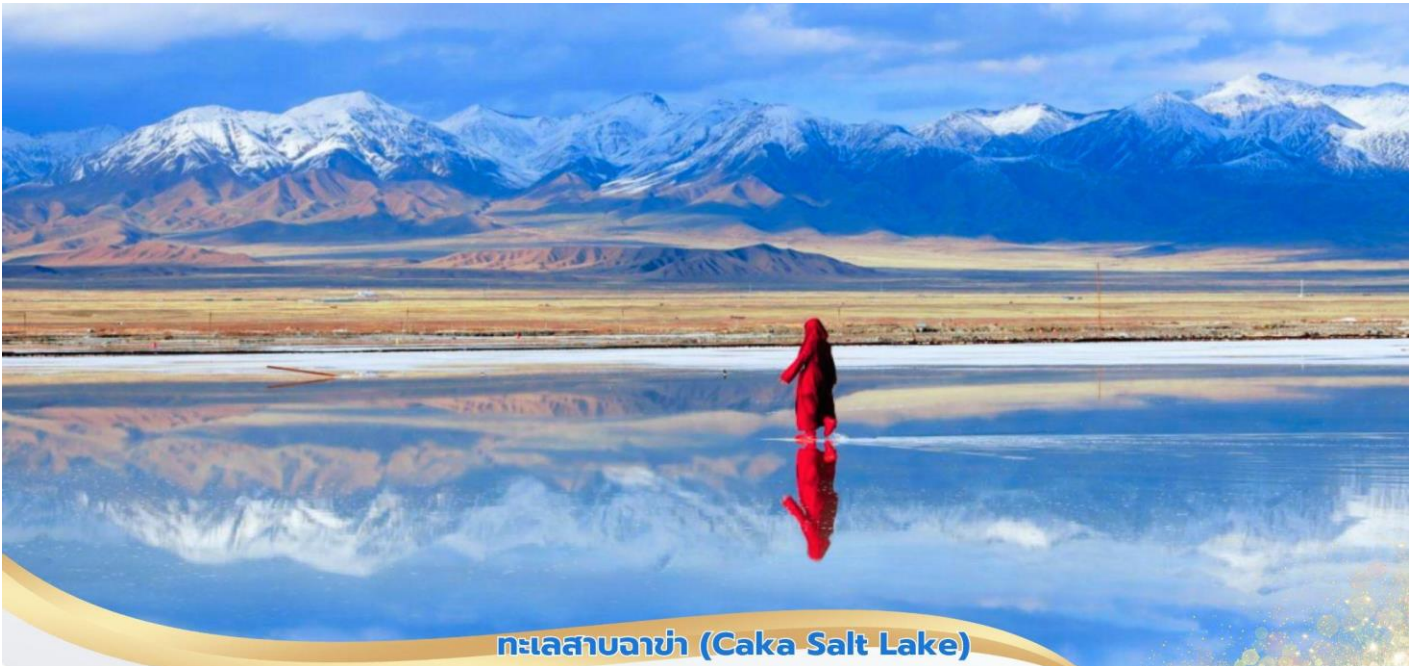
ทะเลสาบจาช่า (Caka Salt Lake)

นำท่านชม ทะเลสาบเกลือจาช่า (Caka Salt Lake) หรือที่รู้จักในชื่อ "กระจกแห่งสวรรค์" ทะเลสาบนี้มีชื่อเสียงจากน้ำใสสะอาดที่สะท้อนท้องฟ้าและภูเขาโดยรอบราวกับกระจกขนาดยักษ์ที่สะท้อนโลกกลับหัวอย่างสวยงาม