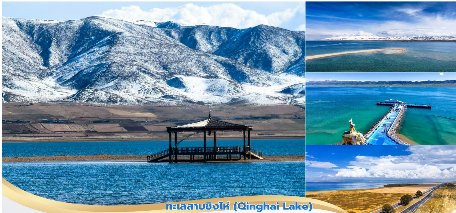
ทะเลสาบชิงไห่ (Qinghai Lake)

บ่าย นำท่านเดินทางต่อไปสู่ ทะเลสาบชิงไห่ (Qinghai Lake, 青海湖) เป็นทะเลสาบน้ำเค็มที่ใหญ่ที่สุดใน ประเทศจีน ตั้งอยู่ในมณฑลชิงไห่ (Qinghai) ท่ามกลางเทือกเขาชิงไห่-ทิเบต มีความสวยงามโดดเด่นด้วยน้ำสีครามเข้ม ตัดกับท้องฟ้าและภูเขาหิมะทะเลสาบแห่งนี้มีความงดงามตามธรรมชาติและมีความสำคัญทางวัฒนธรรม ทำให้เป็นหนึ่งใน ในจุดหมายปลายทางยอดนิยมของนักท่องเที่ยว