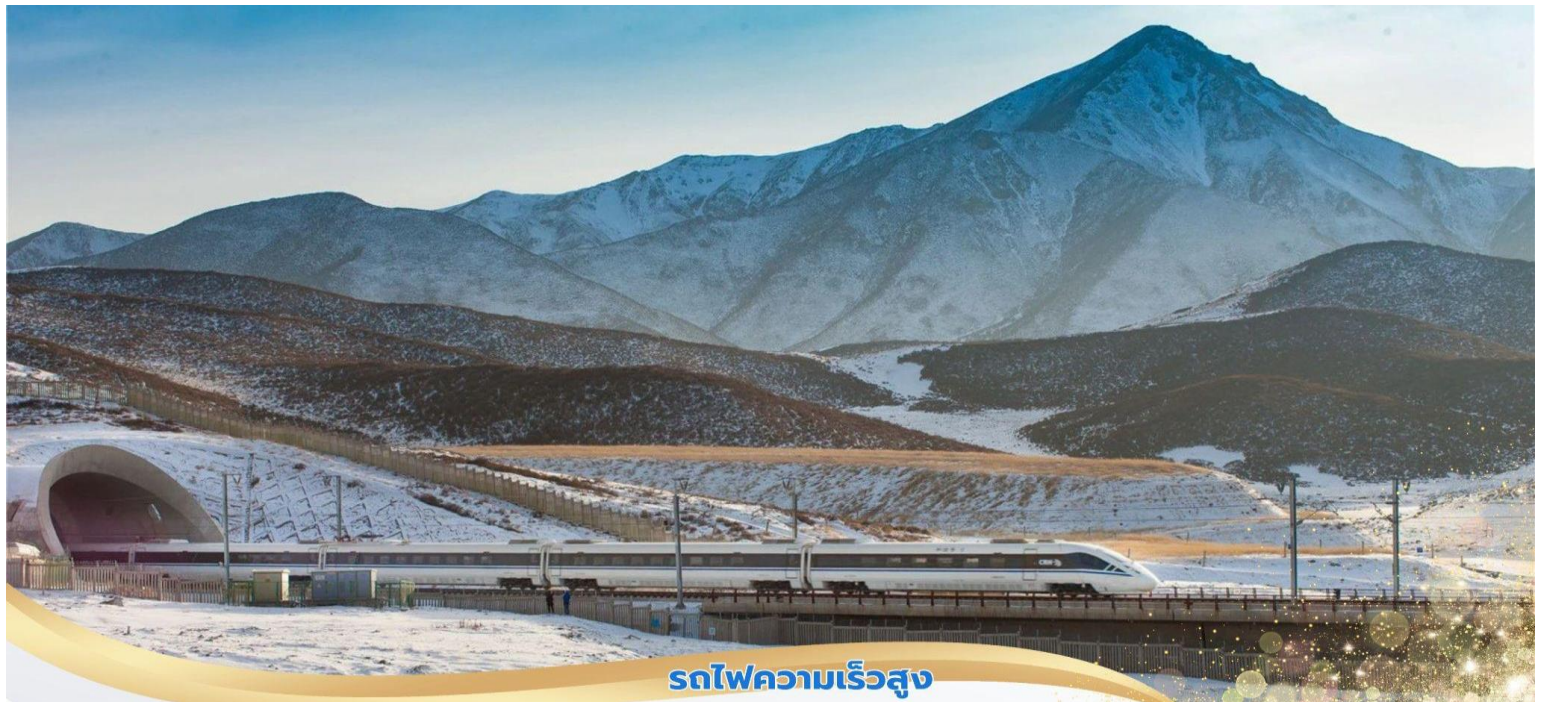
รถไฟความเร็วสูง

โทรศัพท์ : 042-246662 / 086-4515274 E-mail : journeyticket@hotmail.com