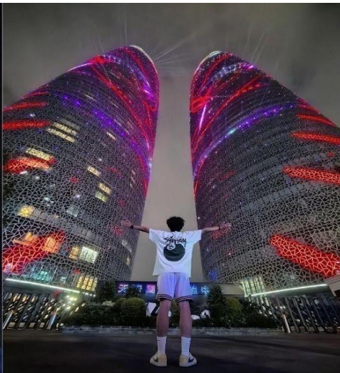
ตึกแฝดเทียนฟู่ (Tianfu International Financial Center Towers)