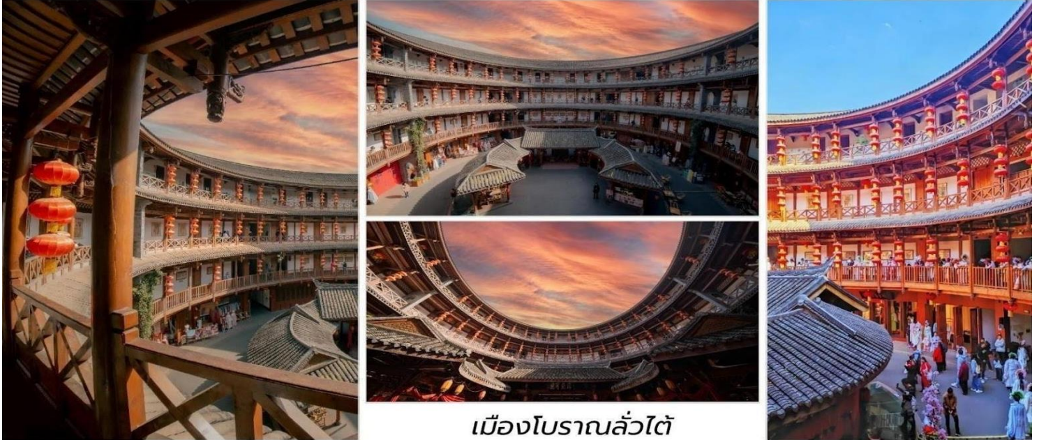
เมืองโบราณลั่วไต

บ่าย นำท่านสู่ ถนนคนเดินเจียนซื่อสู เป็นย่านการค้าที่ใหญ่เป็นอันดับ 2 ของเฉิงตู และเป็นถนนสายอาหารที่มีชื่อเสียงโด่งดังมาก โดดเด่นด้วยสตรีทฟู้ดที่ได้รับความนิยมสูง ถนนสายนี้เชื่อมระหว่างวงแหวนรอบที่ 2