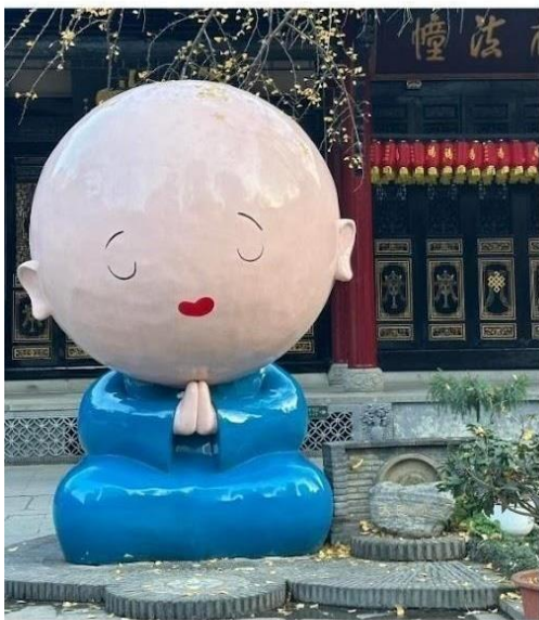
วัดต้าจื่อ

นำท่านสู่ ถนนคนเดินไท่กูหลี่ สัมผัสบรรยากาศแหล่งช้อปปิ้งสุดหรูที่ผสมผสานสถาปัตยกรรมแบบวัด