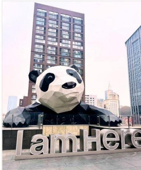
หมีแพนด้ายักษ์ กำลังปั้นตึก IFS