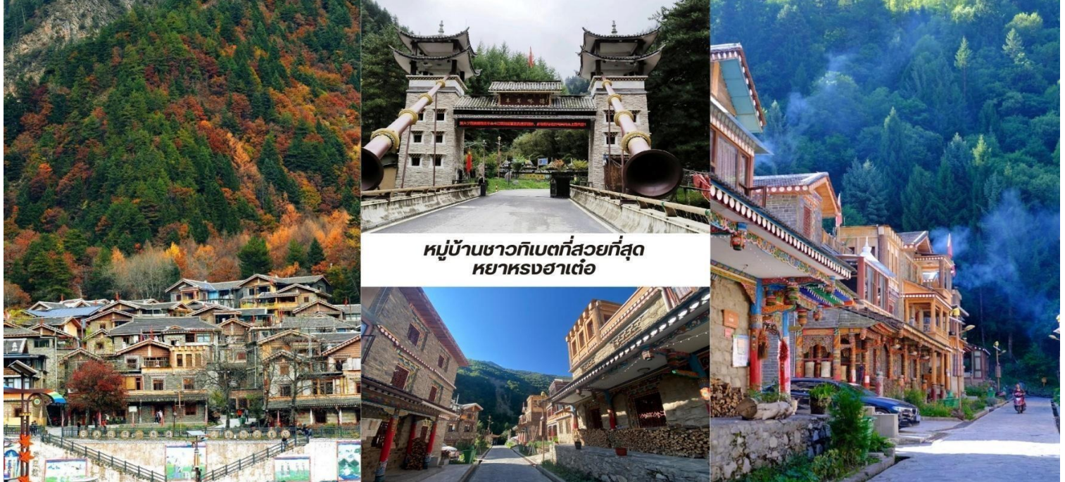
หมู่บ้านชาวกิเบตที่สวยงามที่สุด หยางหงฮาเต้อ