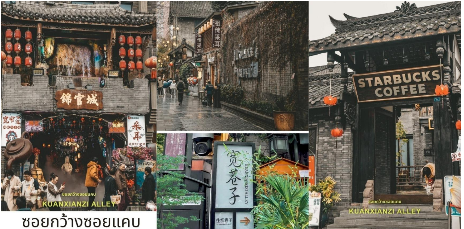
ชอยกว้างชอยแคบ

นำท่านชม ชอยกว้างแคบ (Kuanzhai Alley, 宽窄巷子) เส้นไหมเมืองเก่าที่ผสมผสานความทันสมัยใจกลางเจียงตู ชอยกว้างแคบไม่ใช่แค่ถนนคนเดิน แต่เป็นย่านประวัติศาสตร์ที่ได้รับการอนุรักษ์และปรับปรุงอย่างงดงาม ประกอบด้วยตรอกหลัก 3 สาย ที่ขนานกันไป โดยแต่ละตรอกสะท้อนบรรยากาศและบทบาทที่แตกต่างกัน ตั้งแต่สมัยราชวงศ์ชิงเมื่อ 300 กว่าปีก่อน จนถึงปัจจุบันย่านชอยกว้างแคบประกอบด้วย 3 ตรอก ได้แก่