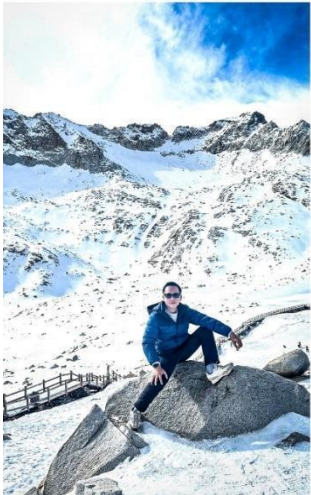
อุทยานตำกู่ปิงชว่น แหล่งท่องเที่ยวระดับ AAAA

ทาง 1,226 เมตร ขึ้นไปที่ความสูง 3,400 เมตรจากระดับน้ำทะเล ชมภูเขาหิมะ 3 ลูก ที่เชื่อว่าเป็นสันหลังมังกรที่มีความงามที่เป็นภูเขาหิมะสีขาว ตัดกับท้องฟ้าสีครามสดใส พาท่าน ชมทะเลสาบตำกู่ หรืออีกชื่อ ทะเลสาบน้ำมรดกของพร ซึ่งมีเรื่องราวเล่าขานของชนเผ่าชาวพื้นเมืองว่าหากมีเรื่องร้อนใจให้กราบไหว้เทพเจ้าที่คุ้มครองทะเลสาบแห่งนี้จะทำให้เรื่องร้อนใจคลายลงหรือใครขอพรต่อเทพเจ้าคุ้มครองทะเลสาบแห่งนี้ก็จะสมหวังดังที่ขอพรไว้ ทำให้ทะเลสาบแห่งนี้ถือเป็นทะเลสาบที่มีความสำคัญมากและมีประวัติความเป็นมาที่ยาวนานกว่า 1,000 ปี เมื่อขึ้นมาถึงยอดเขา คุณจะ得以ยืนอยู่บนจุดชมวิวที่ความสูง 4,860 เมตร ซึ่งเป็นจุดที่มองเห็นธารน้ำแข็งโบราณที่ก่อตัวมานับพันปี และสามารถชมวิวเทือกเขาที่ถูกปกคลุมด้วยหิมะได้อย่างสุดลูกหูลูกตา สมควรแก่เวลาพาท่านลงจากเขา