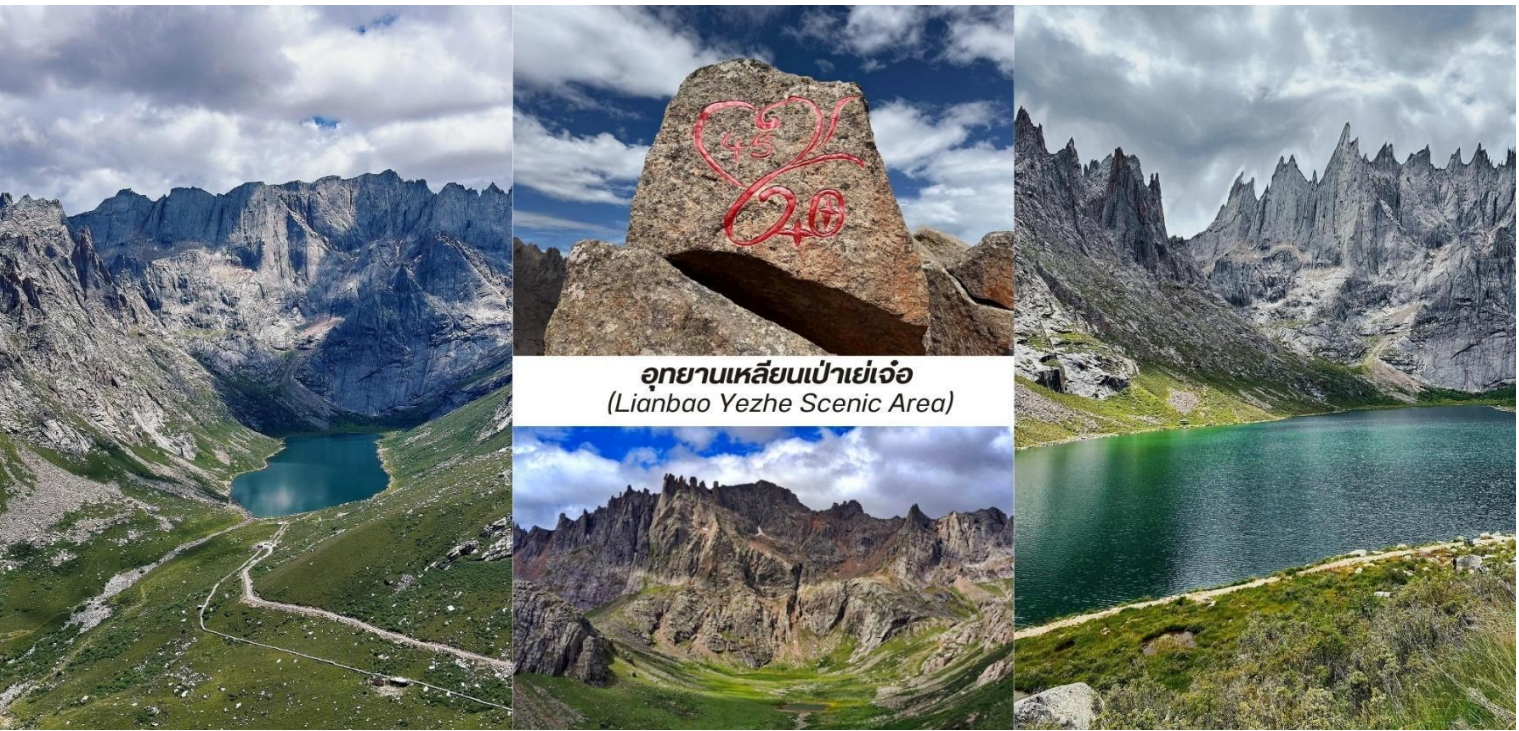
อุทยานเหลียนเป่าเย่เจ้อ (Lianbao Yezhe Scenic Area)

บ่าย นำท่านเดินทางสู่ เมืองหลี่เซียน (Lixian, 理县) ตั้งอยู่ในเขตที่ราบสูงอาปา มณฑลเสฉวนเป็นเมืองเล็กที่ซ่อนตัวอยู่ในหุบเขาที่สวยงามเป็นจุดหมายปลายทางที่สมบูรณ์แบบสำหรับนักเดินทางที่ต้องการ หลีกหนีจากความวุ่นวายของเมืองใหญ่เพื่อสัมผัสกับธรรมชาติที่เขียวสงบและวัฒนธรรมทิเบตที่เข้มข้น ใช้เวลาเดินทางประมาณ 4 ชั่วโมง