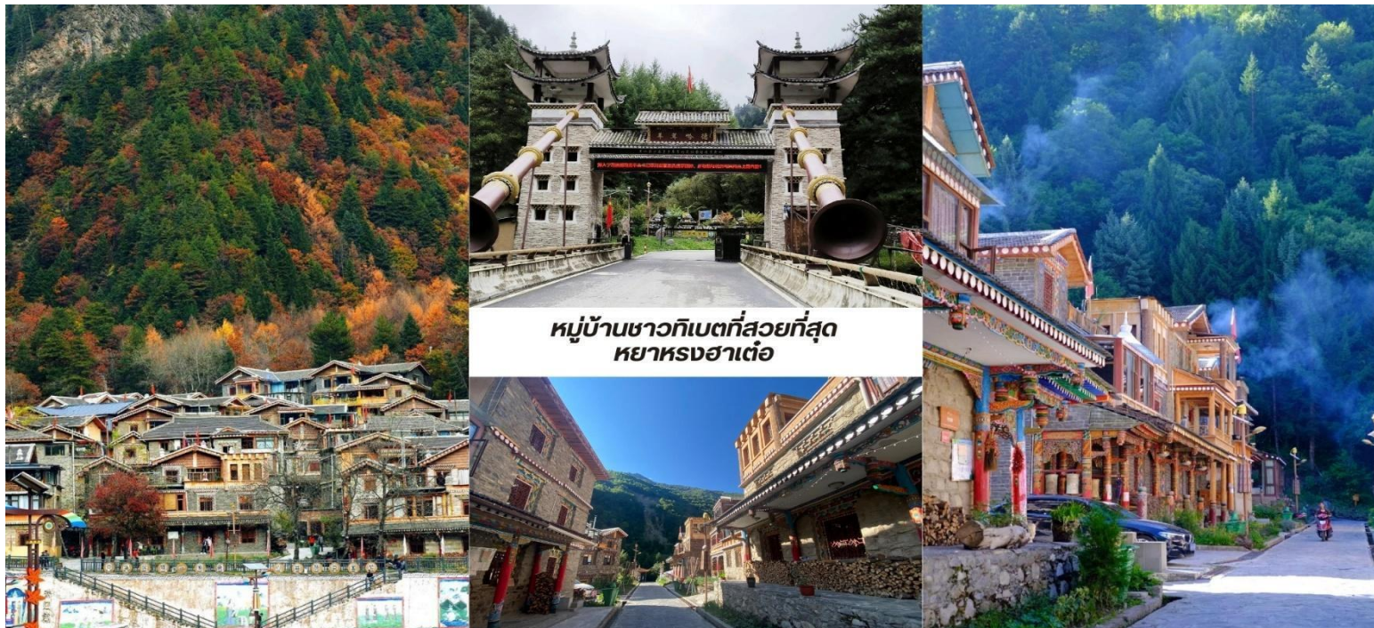
หมู่บ้านชาวทิเบตที่สวยงามที่สุด หย่าหงฮาเต๋อ

บ่าย นำท่านชม หมู่บ้านชาวทิเบตที่สวยงามที่สุด หย่าหงฮาเต๋อ (Yangrong Hades, 羊茸哈德) หมู่บ้านแห่งนี้เคยเป็นหมู่บ้านยากจนบนภูเขา แต่ด้วยการย้ายถิ่นฐานและพัฒนาการท่องเที่ยว ทำให้กลายเป็นจุดหมายปลายทางที่ดึงดูดนักท่องเที่ยวจากทั่วโลก ทัศนียภาพอันงดงาม หย่าหงฮาเต๋อล้อมรอบด้วยภูเขาสูง มีแม่น้ำเฮย์ส่วย (黑水河) ไหลผ่าน และป่าไม้เขียวชอุ่มตลอดปี โดยเฉพาะในฤดูใบไม้ร่วง ป่าไม้จะเปลี่ยนเป็นสีส้มสดใสของใบไม้เปลี่ยนสี ทำให้ทั้งหมู่บ้านดูเหมือนอยู่ในภาพวาดอันงดงาม หมู่บ้านนี้ยังคงรักษาเอกลักษณ์วัฒนธรรมทิเบตดั้งเดิม ทั้งการแต่งกาย อาหารท้องถิ่น และพิธีกรรมทางศาสนา หย่าหงฮาเต๋อ ไม่เพียงแต่เป็นสถานที่ท่องเที่ยวที่สวยงาม เท่านั้น แต่ยังเป็นหมู่บ้านที่สะท้อนให้เห็นถึงการพัฒนาจากความยากจนสู่ความมั่งคั่งผ่านการผสมผสานการอนุรักษ์วัฒนธรรมดั้งเดิมกับการท่องเที่ยวได้อย่างลงตัว