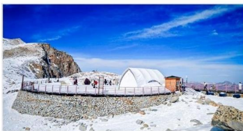
อุทยานตำกู่ปิงชว่น