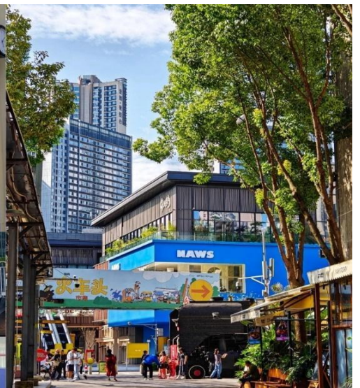
ตงเจียวจี้ (Eastern Suburb Memory)