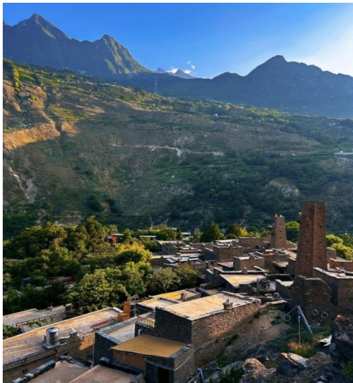
หมู่บ้านโบราณเชียงเตาผิง (Taoping Qiang Village)