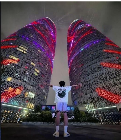
ตึกแฝดเทียนฟู่ (Tianfu International Financial Center Towers)