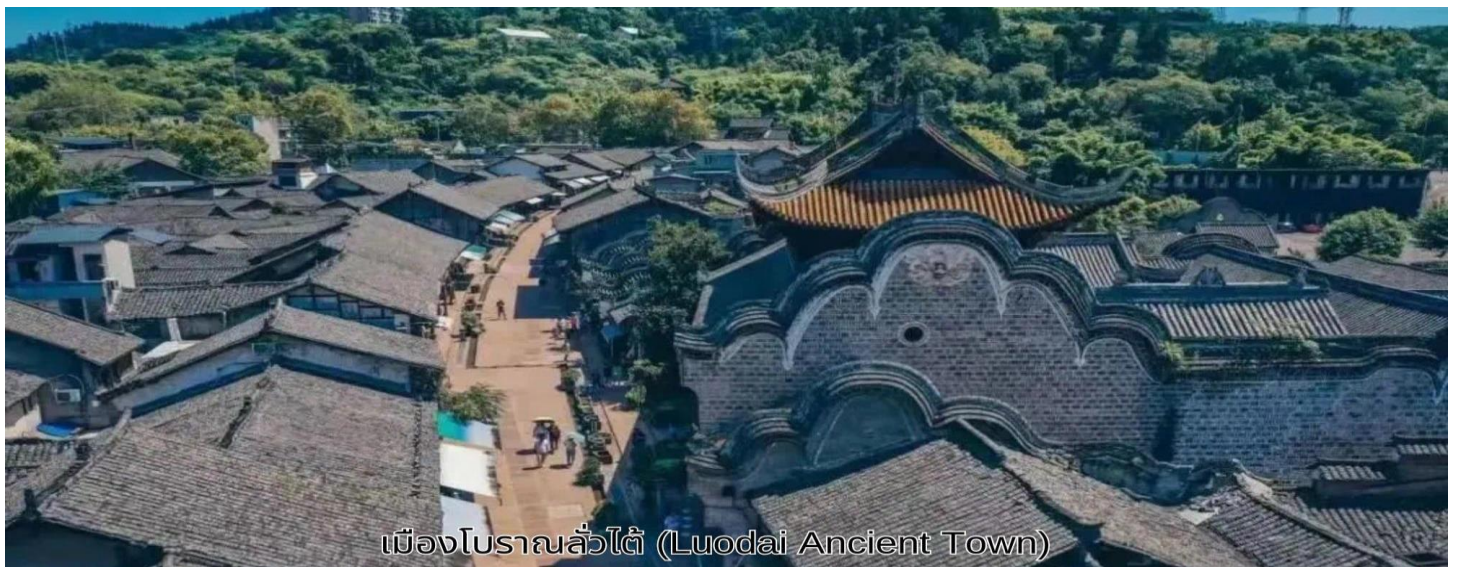
เมืองโบราณลั่วไต (Luodai Ancient Town)

นำท่านชม เมืองโบราณลั่วไต เมืองนี้มีชื่อเสียงเป็นพิเศษในด้านการอนุรักษ์โบราณวัตถุ ทางวัฒนธรรมระดับชาติที่สำคัญพิพิธภัณฑสถานธรรมชาติและสวนอากาศ สถาปัตยกรรมจีนโบราณเป็นรูปแบบสถาปัตยกรรมตามแบบฉบับของหมิงและชิง สลักด้วยรูปปั้นมังกร ฟีนิกซ์ ดอกไม้และนกอันน่าทึ่งมีรูปปั้นเหมือนจริงและฝีมือประณีต