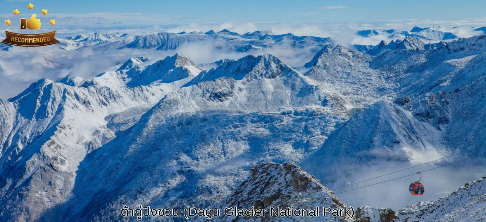
ต้ากู่ปังชว่น (Dagu Glacier National Park)

นำท่านเดินทางสู่ อุทยานต้ากู่ปังชว่น (Dagu Glacier National Park) ใช้เวลาเดินทางประมาณ 3 ชั่วโมง ตั้งอยู่ที่เมืองเฮยชุย (Heishui) ในมณฑลเสฉวน เป็นอุทยานทางธรรมชาติระดับ 4A ที่มีความสวยงามของภูเขาหิมะและทะเลสาบบนยอดเขาที่มีความสูงจากระดับน้ำทะเลประมาณ 5,286 เมตร ถูกค้นพบผ่านดาวเทียมเมื่อปี ค.ศ. 1992 โดยนักวิทยาศาสตร์ชาวญี่ปุ่น หลังจากได้ตรวจสอบพื้นที่ซึ่งทราบว่าเป็นธารน้ำแข็งที่ตั้งอยู่ต่ำที่สุดใหญ่ที่สุด และยังมีอายุน้อยที่สุดในโลกอีกด้วยเป็นธารน้ำแข็งที่งดงามที่สุด ซึ่งก่อตัวมาเป็นเวลาหลายร้อยล้านปี