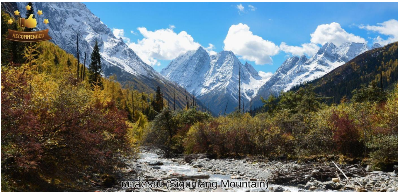
เขาสีดรูณี (Siguniang Mountain)

เช้า บริการอาหารเช้า ณ ห้องอาหารของโรงแรม