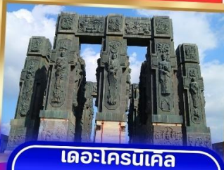
เดอะโครนเคิล ออฟ จอร์เจีย

พิเศษ.. ทดลองชิมไวน์ 3 ชนิด ต้นตำรับของจอร์เจีย