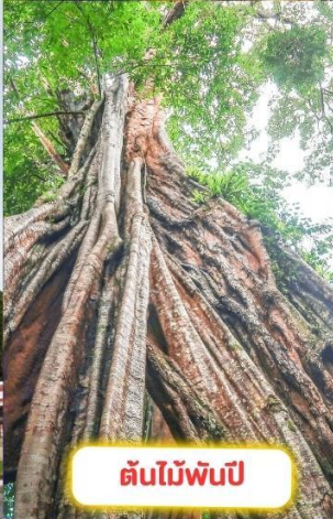
ต้นไม้พันปี