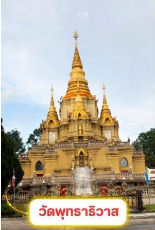
วัดพุทธาธิวาส