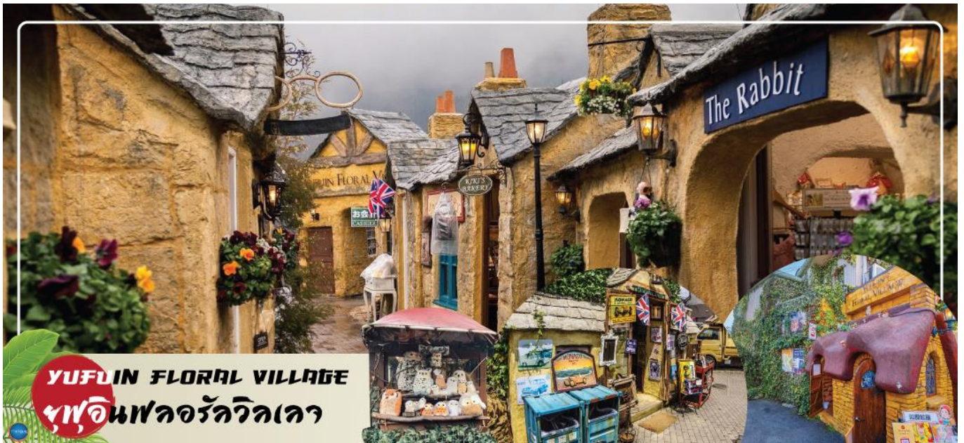
YUFUIN FLORAL VILLAGE ยุฟุอินฟลอรัลวิลเลจ

วันที่สอง ท่าอากาศยานนานาชาติฟุกุโอกะ ประเทศญี่ปุ่น – เมืองฟุกุโอกะ – วัดโทโฮจิ – เมืองยุฟุอิน – หมู่บ้านยุฟุอินฟลอรัล – ทะเลสาบคิริน – เมืองเบปปุ – บ่อนรกเบปปุ จิโกค เมกิริ (เข้าชม 2 บ่อ) – แชนอนเซ็นธรรมชาติ