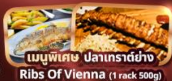
เมนูพิเศษ ปลาเทราต์ย่าง Ribs Of Vienna (1 rack 500g)

ออสเตรีย ชมเมืองฮัลส์สตัดท์ หมู่บ้านริมทะเลสาบ พระราชวังเชินบรุนน์ เมืองลินซ์ จัตุรัสเฮาพท์พลัทซ์ ช้อปปิ้งเอาท์เล็ตสินค้าแบรนด์เนม