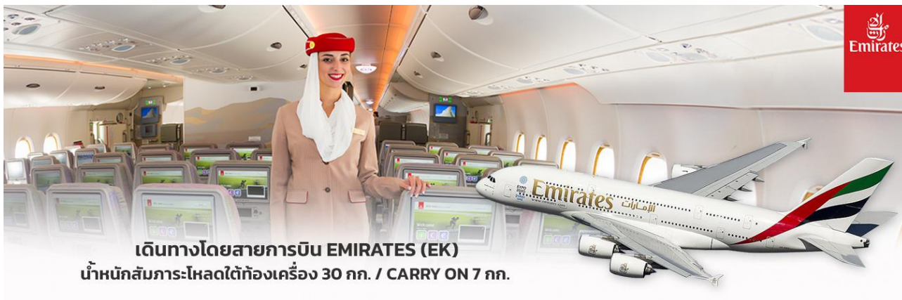
เดินทางโดยสายการบิน EMIRATES (EK) นำนักสัมภาระโหลดใต้ท้องเครื่อง 30 กก. / CARRY ON 7 กก.

โทรศัพท์ : 042-246662 / 086-4515274 E-mail : journeyticket@hotmail.com