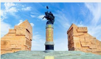
เขตท่องเที่ยวเจงกีสข่าน