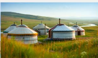
ที่พักแบบกระโจม