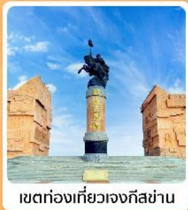
เขตท่องเที่ยวเจงกิสข่าน