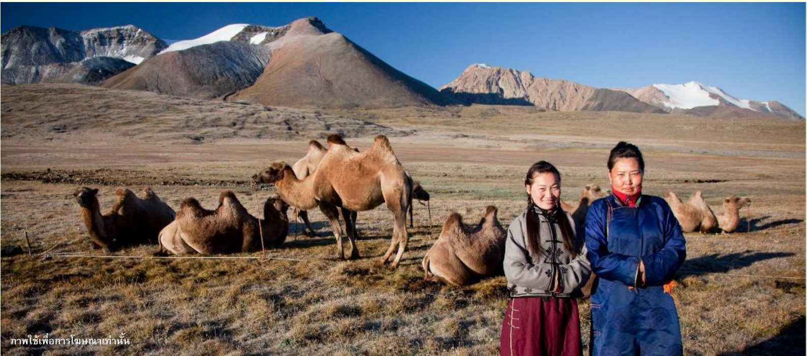
ภาพใช้เพื่อการโฆษณาเท่านั้น

นำท่านร่วมกิจกรรม พิธีต้อนรับแขกสไตล์มองโกล เป็นประเพณีโบราณที่มีมาช้านาน ชาวมองโกลมีอุปนิสัยที่รักเพื่อนฝูงและตรงไปตรงมาไม่เสแสร้ง เมื่อมีเพื่อนหรือแขกมาเยือนก็มักจะผูกมิตรอย่างจริงใจ และนำท่านร่วมกิจกรรม สวมใส่ชุดมองโกล สัมผัสพลังแห่งบรรพบุรุษ สวมเสื้อคลุมแบบดั้งเดิมที่มีสีสันสดใส ปักลวดลายอันประณีต คุณจะสัมผัสได้ถึงพลังแห่งบรรพบุรุษที่เคยปกครองดินแดนครึ่งโลก การสวมหมวกขนสัตว์ ผูกสายรัดเอว พร้อมเครื่องประดับเงินแท้ที่ส่องแสงระยิบระยับ จะทำให้ท่านเสมือนกลายเป็นนักรบแห่งทุ่งหญ้า พร้อมเครื่องประดับเงินแท้ที่ส่องแสงระยิบระยับ ของชนเผ่าที่เคยปกครองดินแดนครึ่งโลก เมื่อคุณยืนท่ามกลางทุ่งหญ้าไร้ขอบเขต