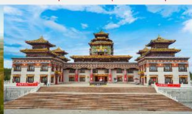
ทำเนียบพระลามะอุหลาน