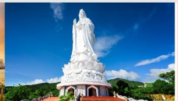
วัดลินห์อิ่ง

*ทางบริษัทฯ ขอสงวนสิทธิ์ในการสลับโปรแกรมทัวร์ตามความเหมาะสมขึ้นอยู่กับสถานการณ์หน้างาน โดยคำนึงถึงผลประโยชน์ของลูกค้าเป็นสำคัญ