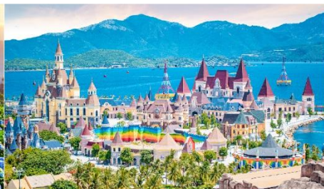
VinWonders NHA TRANG