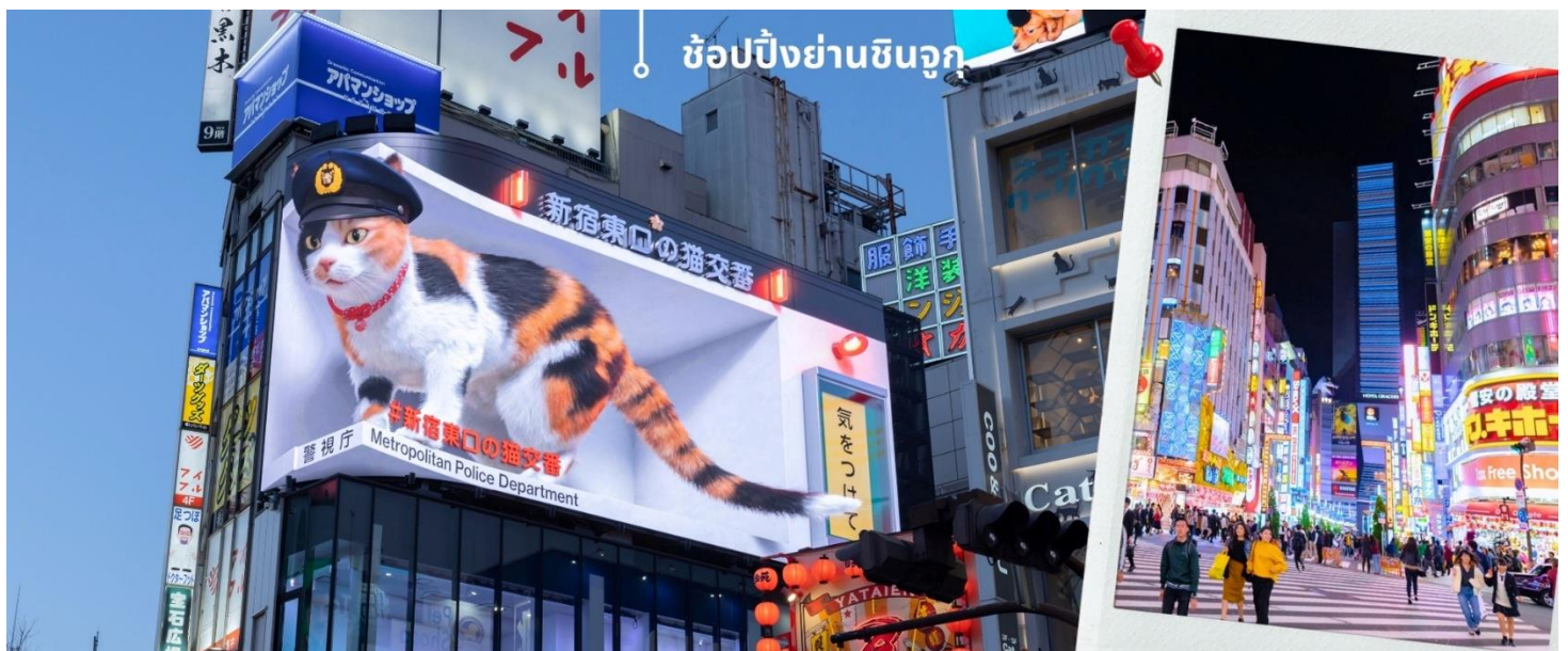
ช้อปปิ้งย่านชินจูกุ

จากนั้นเดินทางเข้าสู่ย่าน ซ้อปิ้งชินจูกุ Shinjuku แหล่งช้อปปิ้งชื่อดังในโตเกียวให้ท่านอิสระและเพลิดเพลินกับการช้อปปิ้งสินค้ามากมายทั้งเครื่องใช้ไฟฟ้ากล้องถ่ายรูปดิจิตอลนาฬิกา เครื่องเล่นเกมส์ หรือสินค้าที่จะเอาใจคุณผู้หญิงด้วยกระเป๋า รองเท้า เสื้อผ้าแบรนด์เนม เสื้อผ้าแฟชั่นสำหรับวัยรุ่น เครื่องสำอางยี่ห้อดังของญี่ปุ่นไม่ว่าจะเป็น KOSE, KANEBO, SK II, SHISEDO และอื่นๆอีกมากมาย