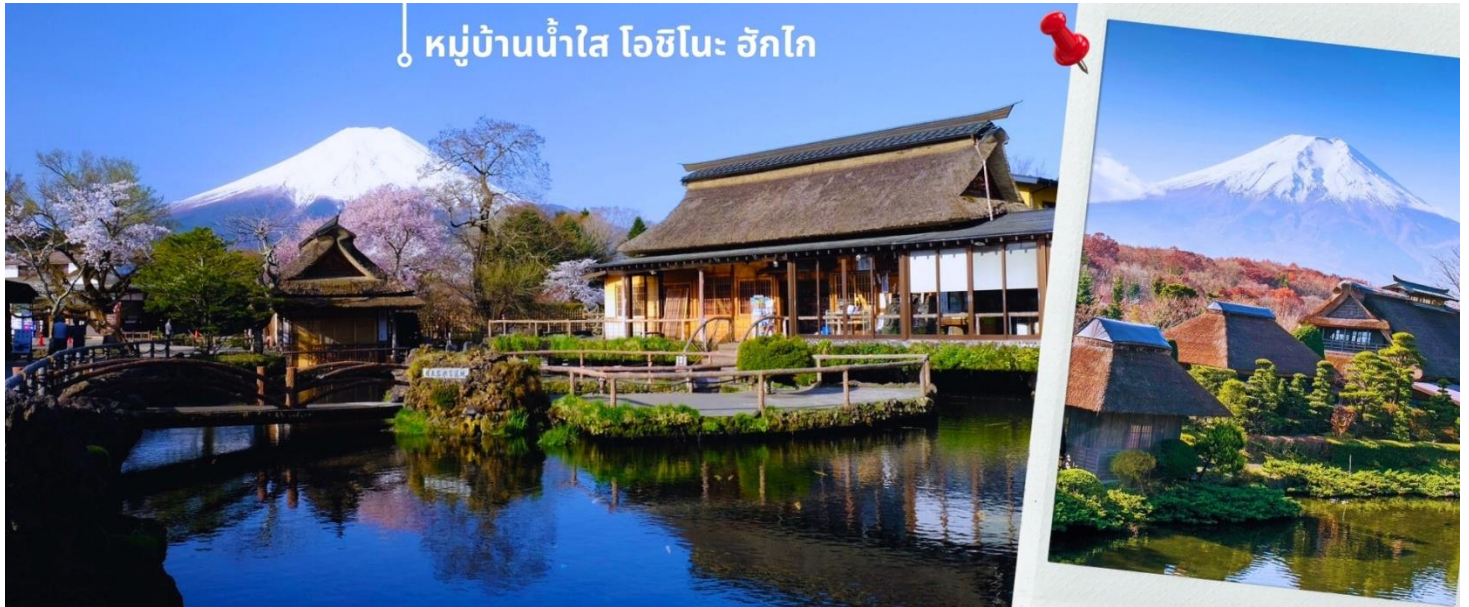
หมู่บ้านน้ำใส โอชิโนะ ซักโก

คัดเลือกให้เป็นหนึ่งในภูมิทัศน์ทางน้ำที่งดงามในปีค.ศ. 1985 อีกด้วยและยังเป็นอีกหนึ่งสถานที่ที่เราสามารถมองเห็นวิวฟูจิด้วยหากวันนั้นเป็นวันที่ฟ้าเปิด