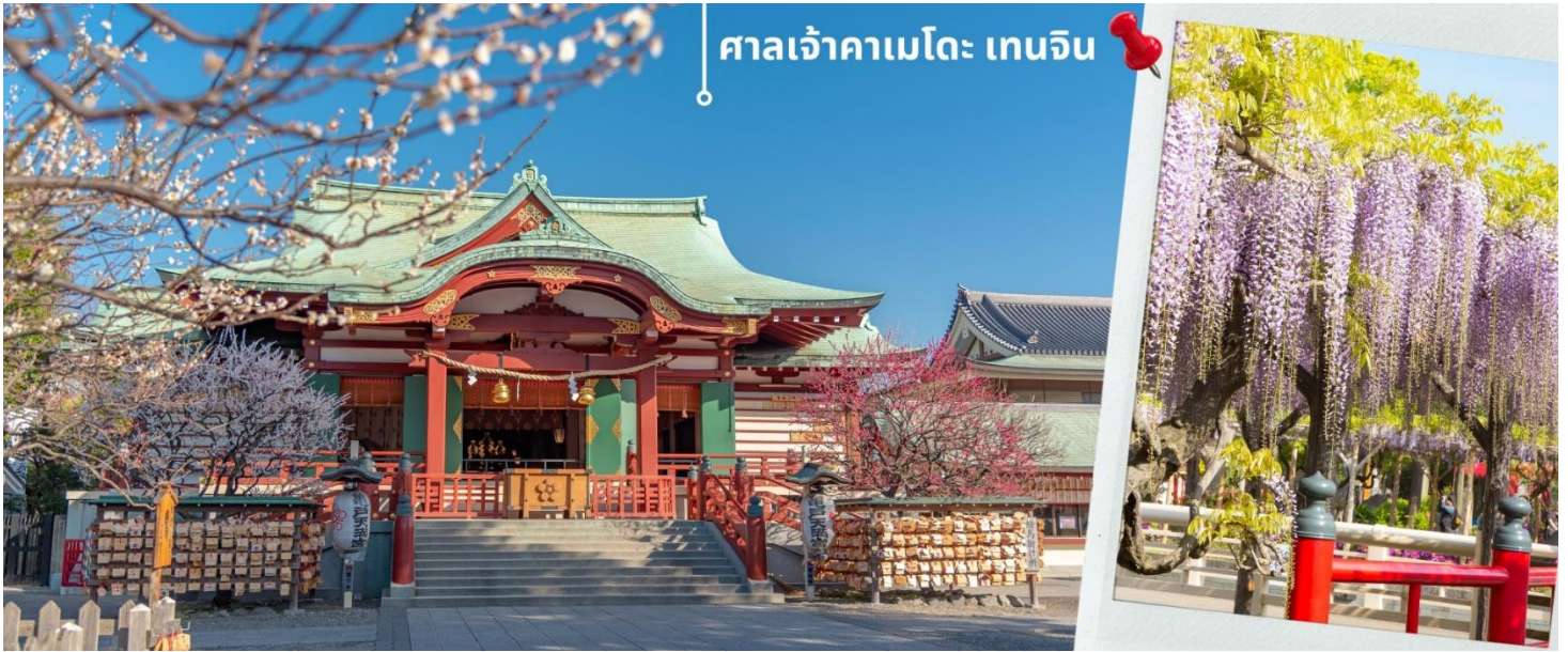
ศาลเจ้าคาเมโตะ เทนจิน

ญี่ปุ่น เนื่องจากเป็นสถานที่สำคัญในหัวข้อพรเพื่อความเป็นสิริมงคลแล้ว รวมถึงเรียนรู้ประวัติศาสตร์ผ่านศิลปะแล้ว นั้น ภายในศาลเจ้าแห่งนี้ยังมีทิวทัศน์ทางธรรมชาติที่สวยงามของดอกวิสทีเรีย ที่มีความโดดเด่นที่สะพานโค้งสีแดงกลางสระน้ำ สำหรับชาวญี่ปุ่น ดอกวิสทีเรีย(Wisteria) เป็นดอกไม้สำคัญอีกชนิดหนึ่งรองจากซากุระ โดยจะออกดอกสีม่วง