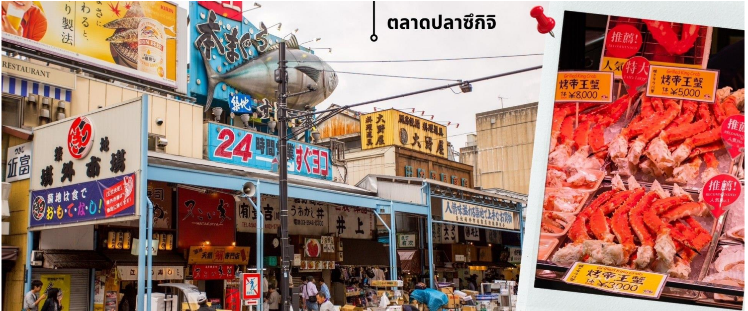
ตลาดปลาซึกิจิ

หลังรับประทานอาหารเช้า นำท่านเดินทางสู่ ตลาดปลาซึกิจิ (Tsukiji Shijo) นับเป็นที่ที่มีชื่อเสียงมากที่สุดของญี่ปุ่น อีกทั้งยังเป็นที่รู้จักกันดีว่าเป็นหนึ่งในตลาดปลาที่ใหญ่ที่สุดในโลก จากการที่มีการซื้อขายสินค้าทะเลกว่า 2,000 ตันต่อวัน ภายในตลาดแบ่งออกเป็น 2 ส่วนใหญ่ๆ คือส่วนภายนอก ซึ่งมีร้านค้าปลีกและร้านอาหารตั้งเรียงรายเป็นจำนวนมาก และส่วนภายใน ซึ่งเป็นบริเวณที่ร้านค้าส่ง