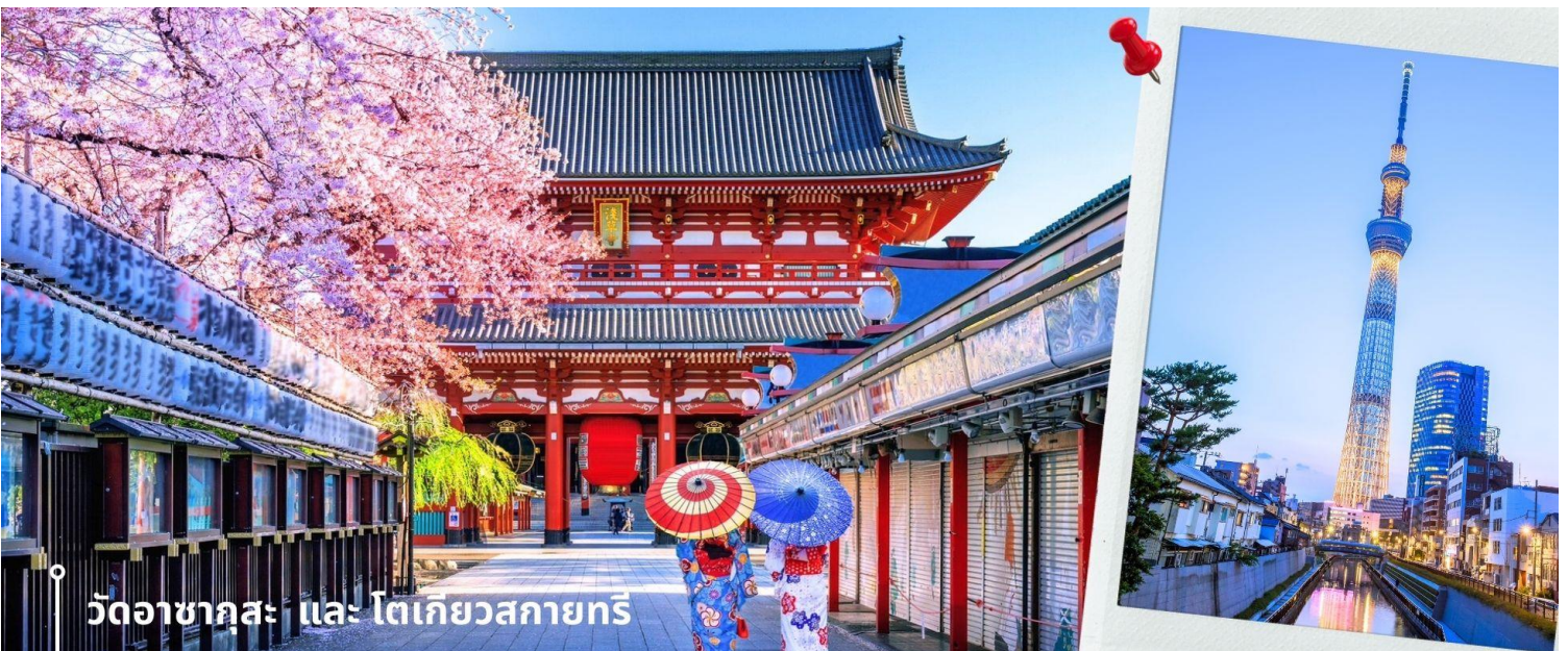
วัดอาซากุสะ และ โตเกียวสกายทรี

หลังจากนั้นนำท่านสักการะ ที่ วัดอาซากุสะ วัดที่ได้ชื่อว่าเป็นวัดที่มีความศักดิ์สิทธิ์และได้รับความเคารพนับถือมากที่สุดแห่งหนึ่งในกรุงโตเกียวภายในประดิษฐานองค์เจ้าแม่กวนอิมทองคำที่มักจะมีผู้คนมากราบไหว้ขอพรเพื่อความเป็นสิริมงคลตลอดทั้งปีประกอบกับภายในวัดยังเป็นที่ตั้งของโคมไฟยักษ์ที่มีขนาดใหญ่ที่สุดในโลกด้วยความสูง 4.5 เมตรซึ่งแขวนห้อยอยู่ ณ ประตูทางเข้าที่อยู่ด้านหน้าสุดของวัดที่มีชื่อว่า “ประตูฟ้าคาร์ณ” บริเวณทางเข้าสู่ตัววิหารจะมี “ถนนนากามิเซะ” ซึ่งเป็นที่ตั้งของร้านค้าขายของที่ระลึกพื้นเมืองต่างๆ มากมายเช่น หน้ากาก ของเล่น รองเท้า พวงกุญแจของที่ระลึก และขนมหวานชนิดทั้งเมล็ดอ่อนปิ้งในตำนาน ดังโงะหนึบหนับและน่องปลาขมมไทยากิ ฯลฯ ให้ทุกท่านได้เลือกซื้อเป็นของฝากของที่ระลึกจากนั้นนำท่านถ่ายรูปกับ “TOKYO SKYTREE” (ด้านนอก) ที่บริเวณสะพานข้าม