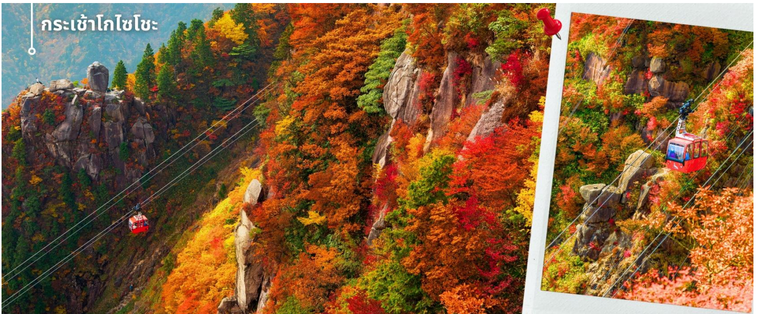
กระเช้าโกโซโซะ

รับประทานอาหารเช้า พาท่านเดินทางสู่จังหวัดมิเอะ นำท่าน นั่งกระเช้าโกโซโซะ (รวมค่ากระเช้า) เพื่อพาท่านเดินทางขึ้นชมวิวป่าไม้เปลี่ยนสี บนเขาโกโซโซะ ซึ่งเป็นหนึ่งในกระเช้าที่มีระยะทางยาวและสามารถชมวิวได้อย่างกว้างไกล ตัวกระเช้าเคลื่อนตัวผ่านแนวภูเขาและหุบเขา เปิดมุมมองแบบพาโนรามาให้เห็นผืนป่าด้านล่างอย่างชัดเจนตลอดเส้นทาง ในช่วงฤดูใบไม้ร่วง ระหว่างการนั่งกระเช้า ท่านจะได้สัมผัสความงดงามของป่าไม้เปลี่ยนสีที่ปกคลุมทั่วทั้งภูเขา โดยสามารถมองเห็นการไล่ระดับสีตามความสูงของพื้นที่ ตั้งแต่บริเวณยอดเขาที่เริ่มเปลี่ยนสีก่อน ไหลลงมายังเชิงเขาอย่างต่อเนื่อง พื้นที่บริเวณนี้ประกอบด้วยไม้หลายชนิด ที่ให้ทั้งสีแดง โทนเหลืองทอง รวมถึงเฉดสีส้มและน้ำตาลอ่อน เมื่อสีสนเหล่านี้ผสมผสานกันเกิดเป็นภาพทิวทัศน์ที่มีมิติ สวยงาม และเปลี่ยนแปลงไปตามระดับความสูงอย่างเป็นธรรมชาติ ท่านสามารถเดินชมเส้นทางธรรมชาติและจุดชมวิวต่าง ๆ เพื่อสัมผัสบรรยากาศของภูเขาและชมทิวทัศน์ของผืนป่าหลากหลายได้อย่างใกล้ชิด