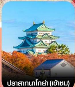
ปราสาทนาโกย่า (เข้าชม)