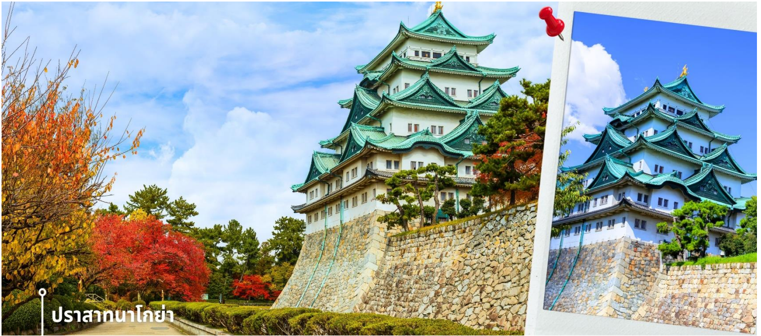
ปราสาทโกย่า

จากนั้นนำท่านเดินทางสู่ สวนโอบาระ ฟุเรโอะ ตั้งอยู่ในเขตโอบาระ เมืองโทโยตะ จังหวัดไอจิ เป็นสถานที่ท่องเที่ยวที่มีเอกลักษณ์โดดเด่นจากการชม “ซากุระสองฤดู” โดยสวนนี้ปลูกต้นซากุระอยู่โดยรอบที่ว่าการประจำเมืองสาขาโอบาระ ซึ่งอยู่ติดกับสวนราว 300 ต้น โดยจะบานในฤดูใบไม้ผลิ ช่วงกลางมีนาคม-ต้นเมษายน และในฤดูใบไม้เปลี่ยนสี ช่วงปลายตุลาคม-ธันวาคม ซึ่งในช่วงปลายปี ดอกซากุระจะผลิบานควบคู่ไปกับใบไม้เปลี่ยนสี สร้างทัศนียภาพที่ผสมผสานระหว่างสีชมพูอ่อนของซากุระ และโทนสีแดง ส้ม เหลืองของใบไม้ได้อย่างสวยงามและหาชมได้ยาก บรรยากาศภายในสวนรายล้อมด้วยธรรมชาติและภูเขา มีความร่มรื่นและเงียบสงบ เหมาะสำหรับการเดินชมทิวทัศน์ และถ่ายภาพ โดยจุดเด่นอยู่ที่การได้สัมผัสความงดงามของสองฤดูกาลในเวลาเดียวกัน ทำให้สวนแห่งนี้เป็นสถานที่ที่เหมาะสมสำหรับผู้ที่ต้องการชมซากุระในบรรยากาศที่แตกต่างจากช่วงฤดูใบไม้ผลิ ซึ่งจะได้เพลิดเพลินกับทัศนียภาพของซากุระที่แสนงดงาม พร้อมกับวิวใบไม้แดงสีสดใสในเวลาเดียวกัน