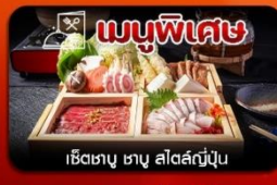
เช็ทเมนูพิเศษ เซ็ทเมนู ฅาญ สลัดญี่ปุ่น

โอซาก้า-เกียวโต-นาโงย่า-ชมซากุระ-โอบาระ-ทุ่งเมเปิ้ลเปลี่ยนสีโคริงเค-ศาลเจ้าเฮอัน-ปราสาทนาโกย่า-ชินไซบาชิ-อิสระช้อปปิ้งเต็มวัน