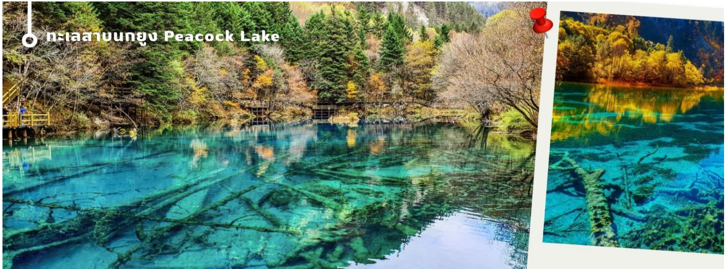
ทะเลสาบอุยง Peacock Lake

ทะเลสาบมีรูปร่างคล้ายกับนกยูง จึงเป็นที่มาของชื่อ แม้พื้นที่จะไม่กว้างมากนัก มีความยาวเพียงแค่ 310 เมตร แต่ความสวยงามของที่นี่ก็ไม่แพ้จุดอื่นๆ ของอุทยานฯ เพราะน้ำในทะเลสาบเป็นสีฟ้าใสราวกับคริสตัล ไล่เฉดฟ้าอ่อนฟ้าอมเขียว และน้ำเงินตามความตื้นลึกของน้ำ ในช่วงฤดูหนาวต้นไม้จะถูกปกคลุมไปด้วยหิมะสีขาวนวล ดูแล้วคล้ายนกยูงกำลังจ้ำจี้ หากมาในช่วงที่มีแสงแดดจะมองเห็นความงดงามได้ทั่วบริเวณ