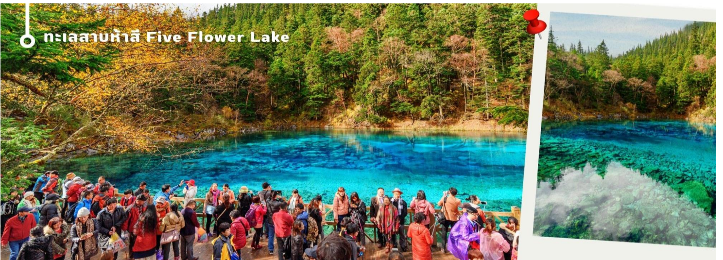
ทะเลสาบห้าสี Five Flower Lake

ทะเลสาบที่ใหญ่ที่สุด สูงที่สุด และลึกที่สุดในจิวจ้ายโกว ด้วยเนื้อที่กว่า 581 ไร่ ความยาวกว่า 7 กิโลเมตร และลึกถึง 103 เมตร ทอดตัวโค้งเป็นรูปพระจันทร์เสี้ยว เนื่องจากหิมะบนภูเขาละลายลงมา น้ำในทะเลสาบสีฟ้าสวยงาม ล้อมรอบด้วยยอดเขาสูงชัน และต้นไม้ใหญ่ที่ปกคลุมด้วยหิมะ งดงามราวหลุดออกมาจากภาพวาด ความพิเศษ