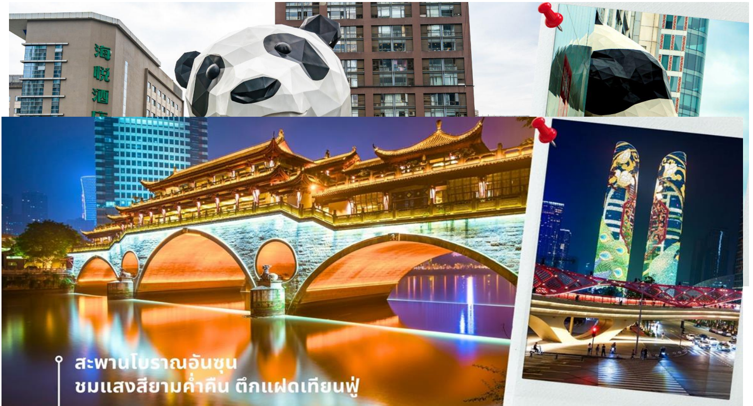
สะพานโบราณอันซุน ชมแสงสียามค่ำคืน ตึกแฝดเทียนฟู่

นำท่านชม สะพานโบราณอันซุน-พร้อมชมแสงสียามค่ำคืน ตึกแฝดเทียนฟู่ เป็นสะพานข้ามคลองที่สร้างเป็นเหมือนอาคารอยู่ข้างบน ในช่วงเวลายามเย็นจะเป็นช่วงที่ผู้คนออกมาชมบรรยากาศบริเวณของสะพานแห่งนี้ และมีร้านค้ามากมาย รวมไปถึงบาร์เครื่องดื่มต่างๆ ที่ดึงดูดนักท่องเที่ยวได้เป็นอย่างดี เป็นสะพานที่ทอดข้ามแม่น้ำจินเจียง และเป็นรูปแบบสะพานมีหลังคา ตามลักษณะสถาปัตยกรรมจีนโบราณ อายุมากกว่า 300 ปี และในบริเวณใกล้เคียง