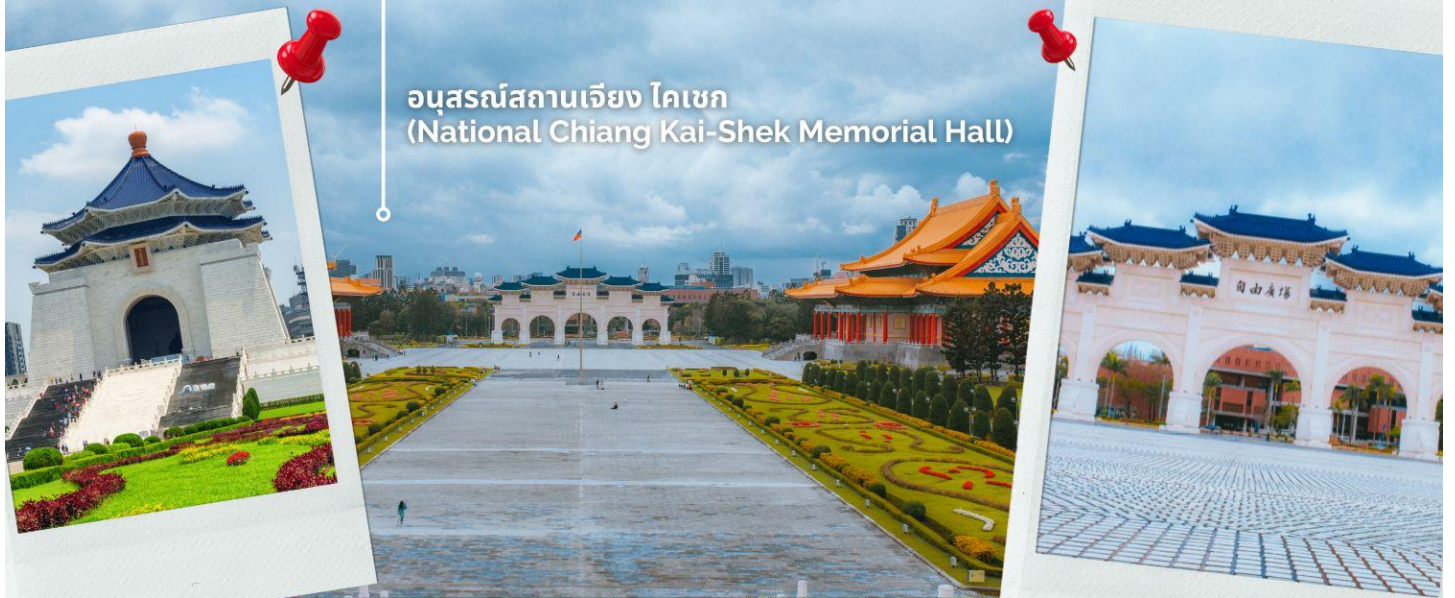
อนุสรณ์สถานเจียง ไคเชก (National Chiang Kai-Shek Memorial Hall)

หลังคาสีน้ำเงิน รวมทั้งยังมีสวนดอกไม้สีแดง ที่เป็นการแสดงออกทางสัญลักษณ์ให้เห็นถึงอิสรภาพ ความเท่าเทียม และความเป็นหนึ่งเดียวกัน ตามสีของธงชาติไต้หวัน