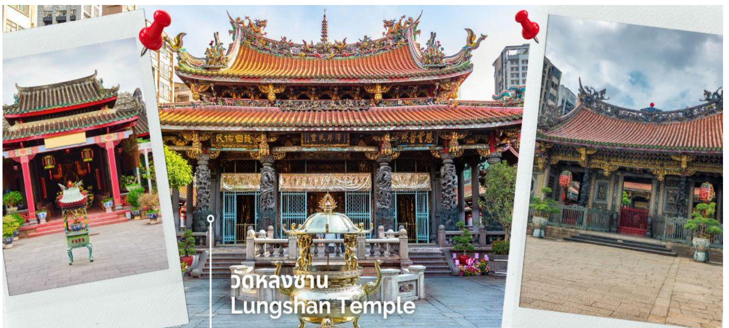
วัดหลงซาน Lungshan Temple

นำท่านสักการะ วัดหลงซาน เป็นหนึ่งในวัดที่เก่าแก่และมีชื่อเสียงมากที่สุดแห่งหนึ่งของเมืองไทเป ตั้งอยู่ในแถบย่านเมืองเก่า มีอายุเกือบ 300 ปี สร้างขึ้นโดยคนจีนชาวจีนผู้เจียนช่วงปีค.ศ.1738 เพื่อเป็นสถานที่สักการะบูชาสิ่งศักดิ์สิทธิ์ตามความเชื่อของชาวจีน มีรูปแบบทางด้านสถาปัตยกรรมคล้ายกับวัดพุทธของจีน แต่มีลูกผสมของความเป็นไต้หวันเข้าไปด้วย ทำให้ที่นี่เป็นอีกหนึ่งแหล่งท่องเที่ยวที่ไม่ควรพลาด และภายในก็ยังมีเทพเจ้าองค์อื่นๆตามความเชื่อของชาวจีนอีกมากกว่า 100 องค์ด้านในมาจากทั้งศาสนาพุทธ เต๋า และขงจื้อ เช่น เจ้าแม่ทับทิม ที่เกี่ยวข้องกับการเดินทาง,เทพเจ้ากวนอู เรื่องความซื่อสัตย์และหน้าที่การงาน และเทพเย่วเหล่า หรือ ผู้เฒ่าจันทรา ที่เชื่อกันว่าเป็นเทพผู้ผูกด้ายแดงให้สมหวังด้านความรัก