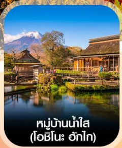
หมู่บ้านน้ำใส (โอชิโนะ ฮักไก)