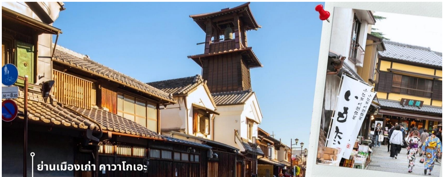
ย่านเมืองเก่า คาวาโกเอะ

07.50 น. เดินทางถึงสนามบินนาริตะ ประเทศญี่ปุ่น หลังจากผ่านพิธีตรวจคนเข้าเมืองและศุลกากรแล้ว นำท่านขึ้นรถไฟใต้ดินปรับอากาศ พาท่านเดินทางสู่ นำท่านเดินทางสู่ ย่านเมืองเก่าคาวาโกเอะ เมืองเก่าที่ได้รับสมญานามว่า “เอโดะน้อย” ด้วยความโดดเด่นของอาคารสไตล์แบบญี่ปุ่นดั้งเดิม ที่เรียงรายสองฝั่งถนนอย่างมีเสน่ห์ ราวกับได้ย้อนเวลากลับไปในยุคเอโดะ ใจกลางเมืองแห่งนี้คือ ถนนคุระซุคุริ Kurazukuri-dori ที่เต็มไปด้วยร้านค้าท้องถิ่น คาเฟ่ขนมหวาน และของฝากสไตล์ญี่ปุ่นโบราณ การเดินเล่นที่นี่ไม่ใช่แค่การเที่ยวชมสถาปัตยกรรม แต่ยังได้ซึมซับบรรยากาศที่เงียบสงบ มีเสน่ห์เฉพาะตัว เหมาะสำหรับการถ่ายรูปและเรียนรู้วัฒนธรรมญี่ปุ่นในแบบที่จับต้องได้ สัญลักษณ์สำคัญของเมืองคือ “หอรบซังโทคิโนะคาเนะ” (Toki no Kane) ที่ยังคงดังบอกราววันละ 4 ครั้ง เป็นเสียงแห่งอดีตที่ยังสะท้อนอยู่ในปัจจุบัน ไม่ไกลกัน มีถนนขนมหวานคาชิยะ โยโกโช (Kashiya Yokocho) ซอยเล็ก ๆ ที่เต็มไปด้วยกลิ่นหอมของขนมหวาน ลูกอมโบราณ และขนมญี่ปุ่นหลากชนิด ให้เลือกชิมและซื้อกลับบ้านของฝาก ให้ท่านได้อิสระเดินตามอัธยาศัย เที่ยง รับประทานอาหารเที่ยง ณ ภัตตาคาร (2) เมนูเซ็ตซาบุมุ ซาบู สไตล์ญี่ปุ่น