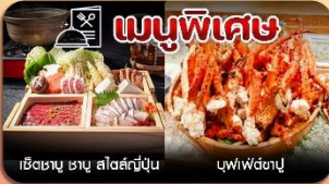
เชิซซาบู ซาบู สไตล์ญี่ปุ่น บุฟเฟ่ต์ซาบู

พักออนเซ็น 1 คืน อาหาร 8 มื้อ เกี้ยวเต็มไม้มีอิสระ