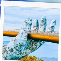
บาน่าฮิลล์