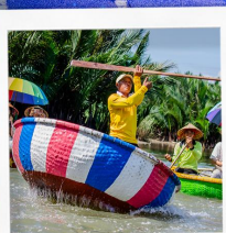
เรือกระดิ่ง

ดานัง ฮอยอัน พักบาน่าฮิลล์ 4วัน 3คืน พัก Hoi An Memory Resort ชมโชว์สุดอลังการ