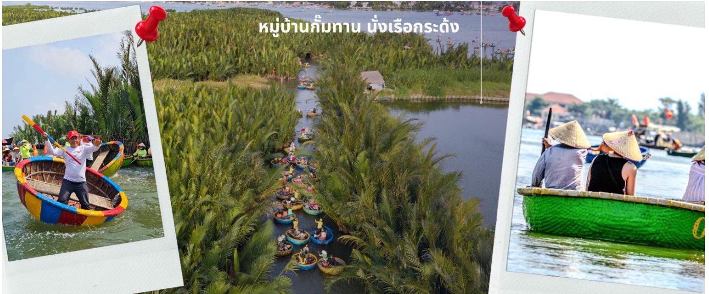
หมู่บ้านก๊มกาน บั้งเรือกระดัง

โทรศัพท์ : 042-246662 / 086-4515274 E-mail : journeyticket@hotmail.com