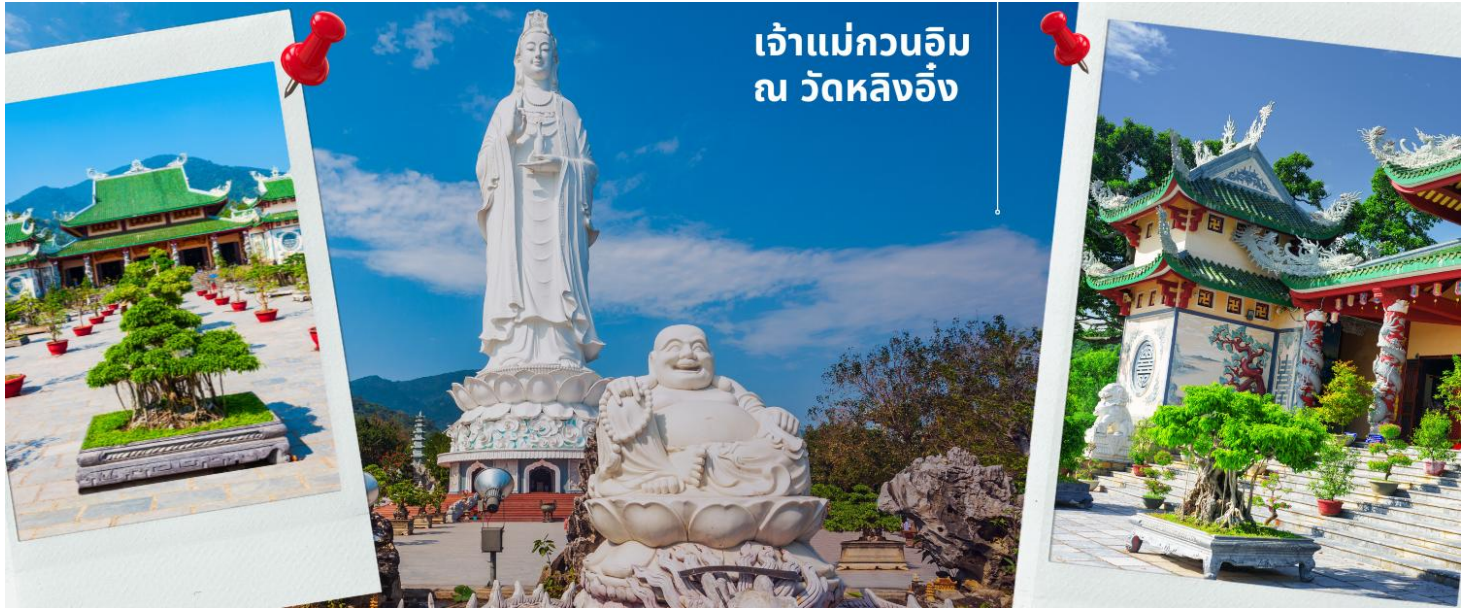
เจ้าแม่กวนอิม ณ วัดหลิงอึ้ง

โทรศัพท์ : 042-246662 / 086-4515274 E-mail : journeyticket@hotmail.com