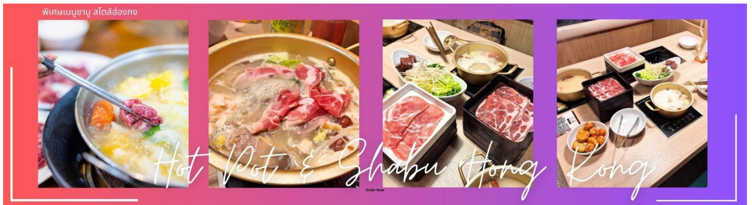
พิเศษเมนูชาบู สไตส์ฮ่องกง