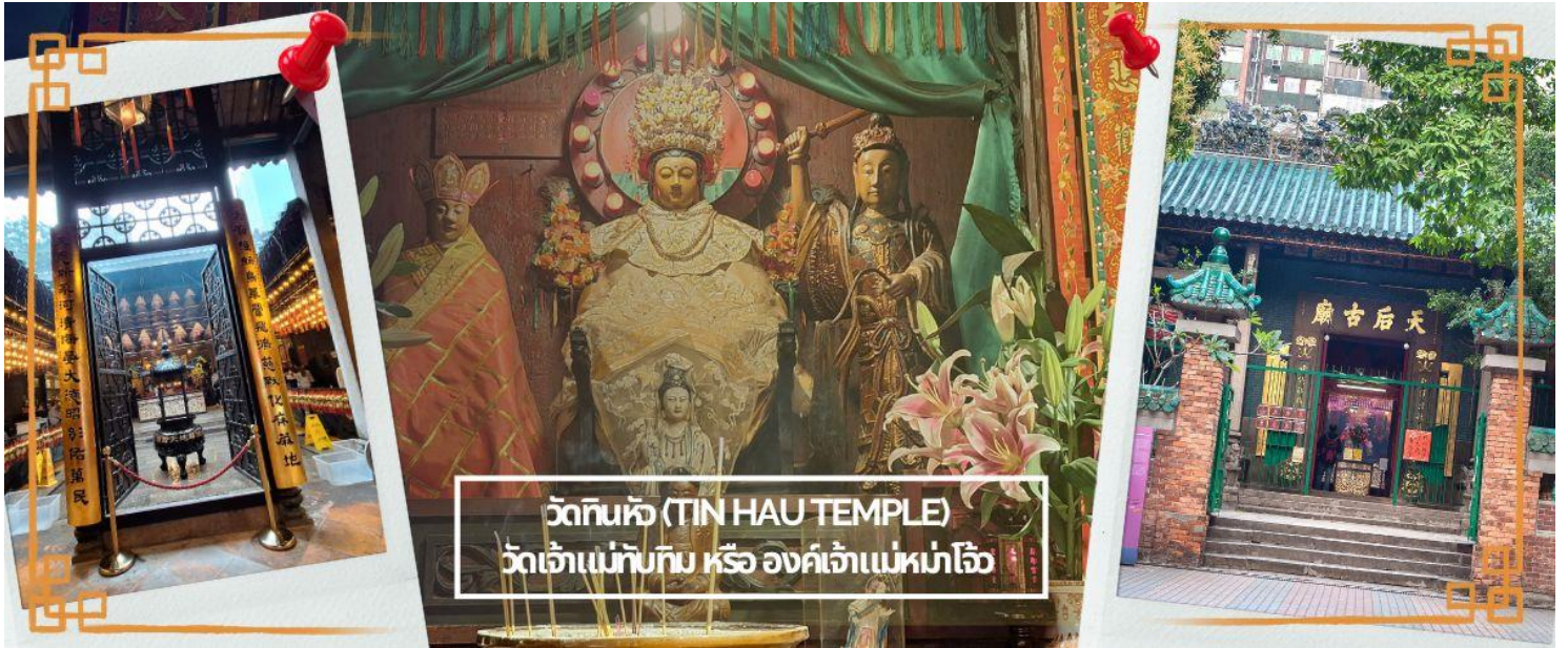
วัดทินหัว (TIN HAU TEMPLE) วัดเจ้าแม่ทับทิม หรือ องค์เจ้าแม่หม่าโจ้ว

โทรศัพท์ : 042-246662 / 086-4515274 E-mail : journeyticket@hotmail.com