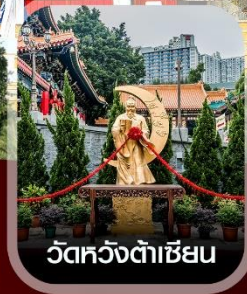
วัดหวังต้าเซียน

✈️ คอนเฟิร์มออกเดินทาง ทุกพีเรียด 2 ท่านขึ้นไป ✈️