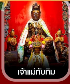
เจ้าแม่ทับทิม

การันตีพักย่านช้อปปิ้ง Isvnu Prudential Hotel