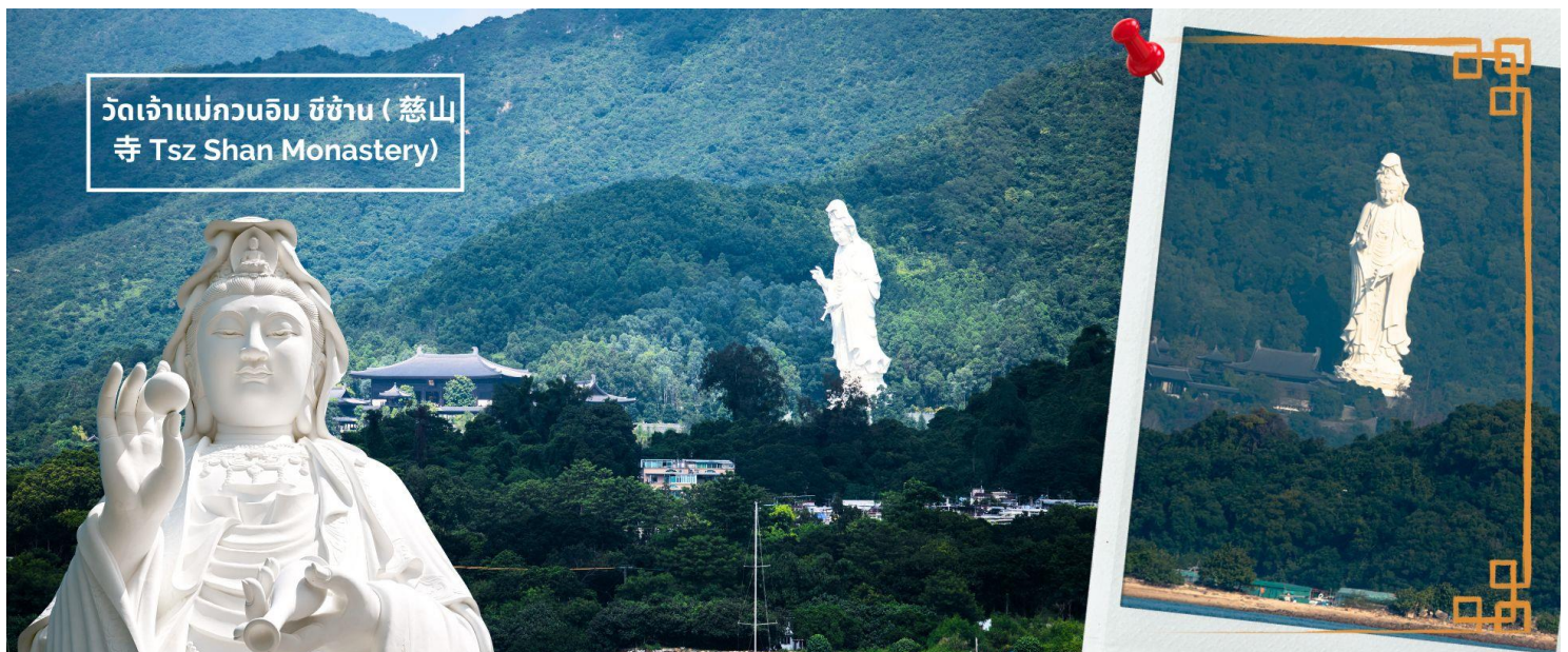
วัดเจ้าแม่กวนอิม ซีซัน (慈山寺 Tsz Shan Monastery)

จากนั้นนำท่านไหว้พระขอพร วัดเจ้าแม่กวนอิม ซีซัน (慈山寺 Tsz Shan Monastery) เจ้าแม่กวนอิมที่ใหญ่ที่สุดเป็นอันดับที่ 2 ของโลก วัดที่เปรียบเสมือนดินแดนสวรรค์บนเกาะฮ่องกง วัดพุทธขนาดใหญ่ที่มีชื่อเสียงมากแห่งหนึ่งของฮ่องกง เป็นที่ประดิษฐานรูปปั้นเจ้าแม่กวนอิมองค์ใหญ่เป็นอันดับสองของโลก เป็นสถานที่ที่มีความศักดิ์สิทธิ์ มีมนต์ขลัง ที่นี่ยังเต็มไปด้วยเรื่องราวของธรรมะ เป็นสถานที่เผยแพร่หลักคำสอนทางพระพุทธศาสนาที่สำคัญของฮ่องกงเลยทีเดียว และเป็นอีกหนึ่งวัดที่อยากแนะนำว่าหากมีโอกาสไปเยือนฮ่องกง จะต้องไม่พลาดที่จะไปสักการะเจ้าแม่กวนอิมขอพรเพื่อความเป็นสิริมงคล ครอบคลุมพื้นที่ 46,764 ตารางเมตร และตัวอาคารต่างๆ ครอบคลุมพื้นที่ประมาณ 5,100 ตารางเมตร ตั้งอยู่บนเนินเขา วิญญาที่อลังการสุดๆ แวดล้อมด้วยวิวทิวทัศน์ธรรมชาติสวยงาม อากาศที่สดชื่นบริสุทธิ์ มาทีเดียวทั้งอิ่มบุญและอิ่มใจกับความงดงามของเจ้าแม่กวนอิม