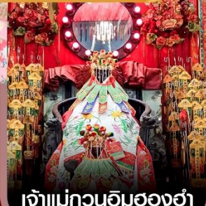
เจ้าแม่กวนอิมฮ่องกง