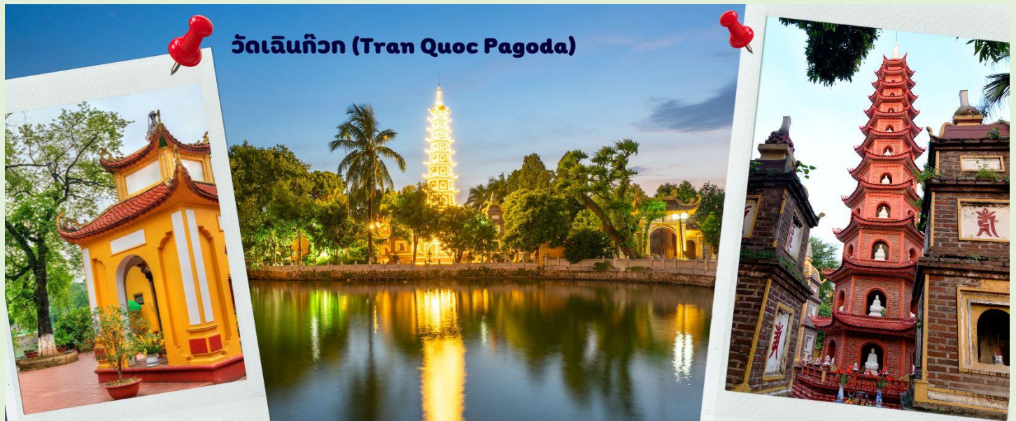
วัดเจินก๊วก (Tran Quoc Pagoda)

จากนั้นนำท่านไป วัดเจินก๊วก (Tran Quoc Pagoda) เป็นวัดที่อยู่ใจกลางเมืองของเวียดนาม ใกล้ชิดกับทะเลสาบตะวันตกของเมืองฮานอย สร้างด้วยสถาปัตยกรรมจีนโบราณ มีความร่มรื่น และบรรยากาศดี จึงเป็นที่นิยมของนักท่องเที่ยวทั้งที่ชื่นชมความงามและมีศรัทธาในพระพุทธศาสนา จากภาพมุมสูงของสถานที่ตั้ง ที่นี่เหมือนตั้งอยู่บนเกาะที่ยื่นลงไปทะเลสาบ แต่มีเส้นทางคมนาคมเข้าถึงที่ สิ่งปลูกสร้างมีการวางผังเป็นอย่างดี ใช้สีสันทึกลับมกสีในโทนสีเหลือง น้ำตาล ตัดกับสีเขียวของต้นไม้ใหญ่ที่โอบล้อมอยู่ในมุมถ่ายภาพจากอีกฝั่งหนึ่ง จะเห็นสิ่งปลูกสร้างสไตล์จีน และเจดีย์หลายชั้นโดดเด่น มีภาพที่สะท้อนลงสู่ผิวน้ำ เป็นภูมิทัศน์ที่งดงามทั้งยามกลางวันและยามค่ำคืนที่มีการเปิดไฟส่องสว่าง