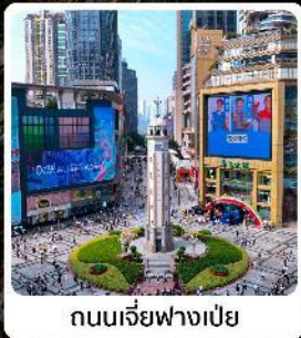
ถนนเรียวฟางเป็ย