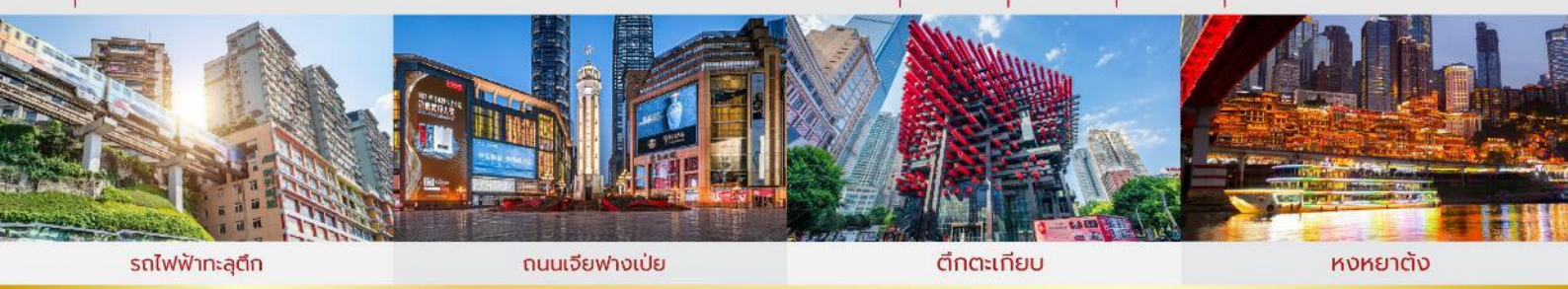
รถไฟฟ้าทะลุตึก ถนนเจี๋ยฟางเป่ย์ ตึกตะเกียบ หงหยาดัง