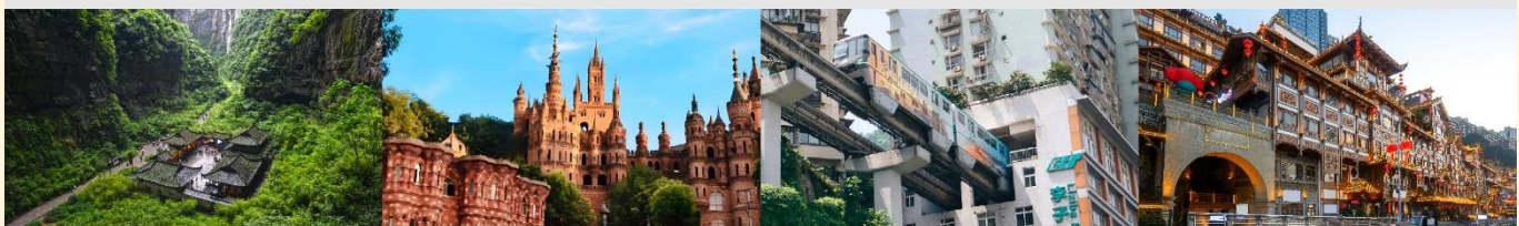
อุทยานแห่งชาติหลุมฟ้า 3 สะพานสวรรค์ Hua Sheng Yuan Dream Castle รถไฟฟ้าทะเลลึก หงหยาดัง