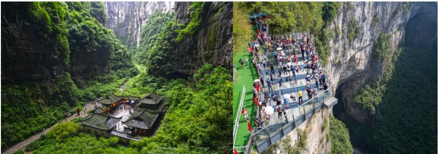
หนึ่งในอุทยานหลุมฟ้า 3 สะพานสวรรค์ เป็นจุดชมวิว

นำท่านเดินทางสู่ อุทยานแห่งชาติหลุมฟ้า และ สะพานสวรรค์ (รวมรถอุทยาน+ลิฟท์+รถแบดเตอร์+จุดชมวิวระเบียงแก้ว) (ถูกจัดให้เป็นมรดกโลกทางธรรมชาติระดับ 5A ภูเขาที่น่าอัศจรรย์ ชม 3 สะพานสวรรค์ แหล่งท่องเที่ยวทางธรรมชาติแหล่งใหม่ล่าสุดที่ได้รับการรับรองจาก ยูเนสโกให้เป็นมรดกโลกทางธรรมชาติในปี ค.ศ. 2007 นอกจากนี้บริเวณหุบเขาด้านล่างยังเป็นที่ตั้งของ บ้านโบราณกลางหุบเขา เป็นฉากใหญ่ที่ใช้ถ่ายทำภาพยนตร์เรื่อง คีโคโนบิลลิ่งกั๊วทอง ล่าสุดเป็นฉากหลังของภาพยนตร์ฮอลลีวู้ดเรื่อง TRANSFORMERS 4 จากนั้นนำท่านชม จุดชมวิวระเบียงแก้ว ขนาดใหญ่ กว้าง 26 ตารางเมตร ยื่นออกมาจากหน้าผาของภูเขาสูง