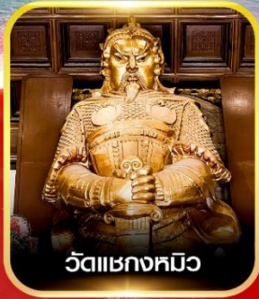
วัดแห่งหมิว