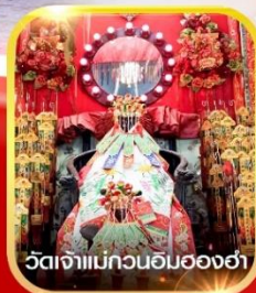
วัดเจ้าแม่กวนอิมของฮา