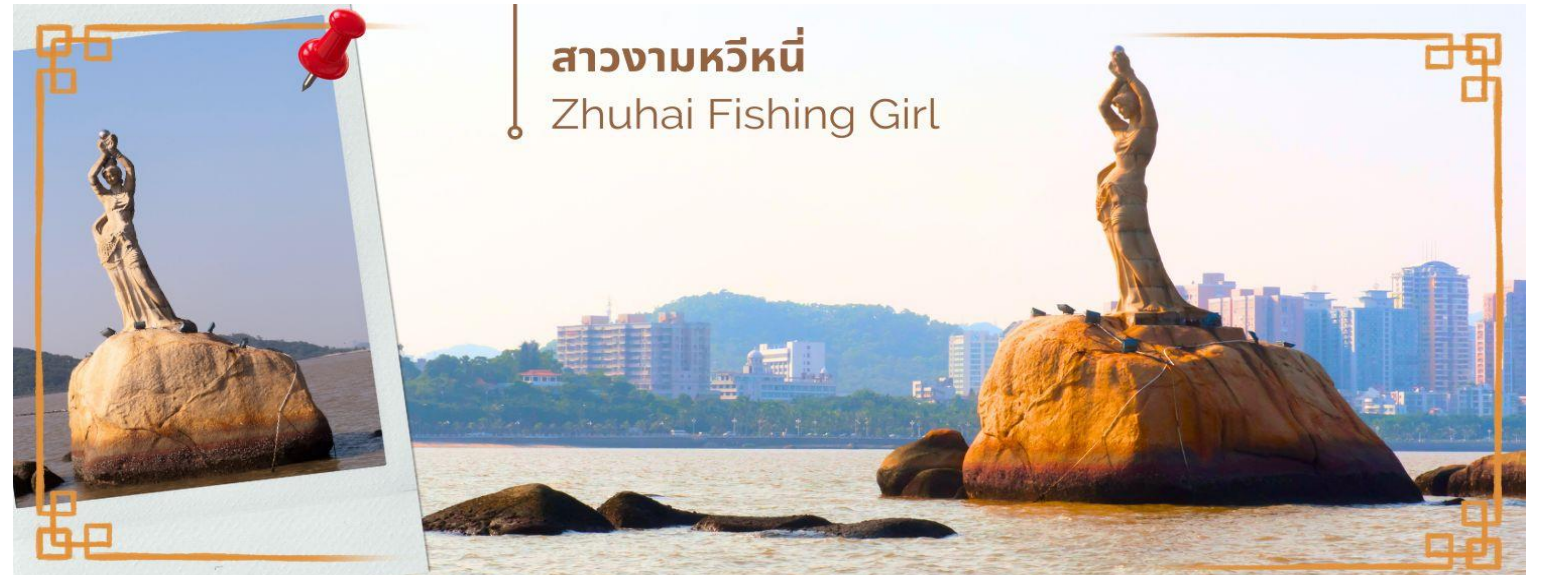
สาวงามหวีหนี่ Zhuhai Fishing Girl

จากนั้นนำท่านแวะซื้อ ยาแก่น้ำร้อนลวก ร้านยา เป่าฟู่หลิง บัวหิมะ ยาประจำบ้านที่มีชื่อเสียง ท่านจะได้ชมการสาธิต การนวดเท้า ซึ่งเป็นอีกวิธีหนึ่งในการผ่อนคลายความเครียด และบำรุงการไหลเวียนของโลหิตด้วยวิธีธรรมชาติ และนำท่าน