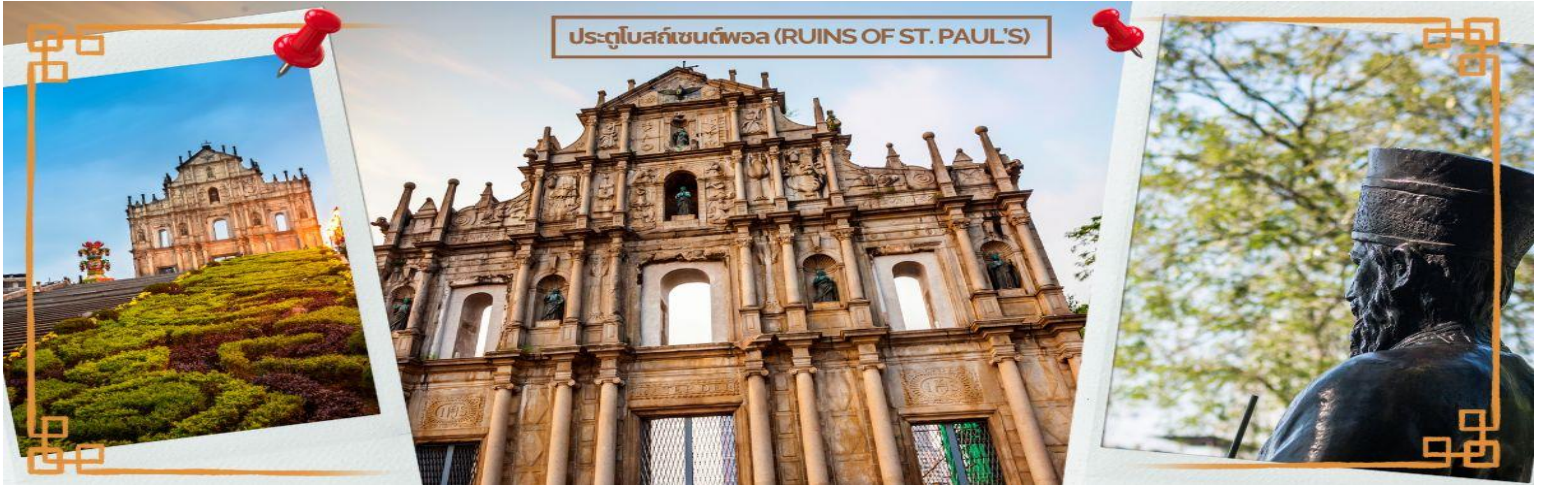
ประตูโบสถ์เซนต์พอล (RUINS OF ST. PAUL'S)

ได้เวลาอันสมควร นำท่านเดินทางสู่ เมืองจูไห่ (ZHUHAI) เป็นเมืองที่มีอาณาบริเวณเขตมหาสมุทรใหญ่ ที่สุด มีเกาะมากที่สุด และมีแนวชายฝั่งทางทะเลยาวที่สุดใน ภูมิภาคสามเหลี่ยมปากแม่น้ำ จูเจียง ซึ่งตั้งอยู่ทางริมฝั่งตะวันตก ของปากแม่น้ำจูเจียง หรือแม่น้ำไข่มุกที่ไหลลงสู่ทะเลจีนใต้ใน มณฑลกวางตุ้ง ทางตอนใต้ของประเทศจีน