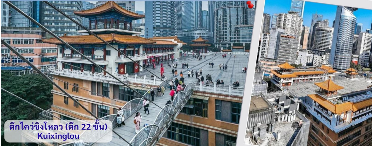
ตึกไควซิงโหลว (ตึก 22 ชั้น) Kuixinglou

ประเทศจีน เนื่องจากภูมิประเทศที่เป็นภูเขา อาคารแห่งนี้จึงมีทางเข้าในระดับที่ต่างกัน เป็นจุดถ่ายรูปและชมวิวที่โดดเด่นของเมืองฉงชิ่งที่ได้ชื่อว่าเป็น "เมืองสามมิติ"