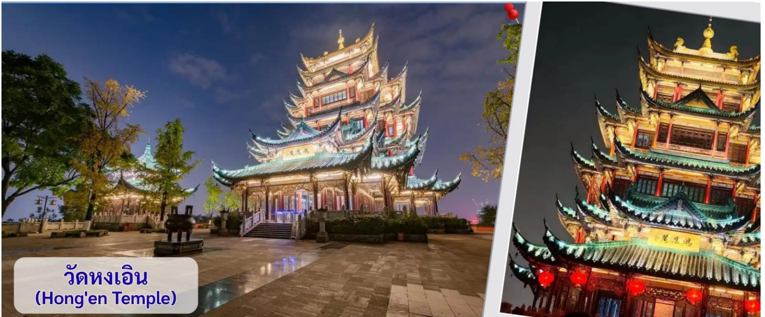
วัดหงเอน (Hong'en Temple)

เอน สูง 7 ชั้นที่ตั้งอยู่บนยอดเขาหลงจี (สูงประมาณ 468 เมตรเหนือระดับน้ำทะเล) สถาปัตยกรรมเป็นสไตล์จีนโบราณดั้งเดิม หลังคามีลวดลายมังกรอย่างประณีต ตัวศาลาล้อมรอบด้วยตึกสูงระฟ้าของเมืองฉงชิ่ง ให้ความรู้สึกเหมือน "วัดโบราณที่ซ่อนตัวอยู่ในมหานครไซเบอร์พังก์" ไฮไลท์ที่ห้ามพลาดเด็ดขาดคือ การชมวิวยามค่ำคืน เมื่อถึงเวลาเปิดไฟ (ประมาณ 18:30 - 19:30 น. เป็นต้นไป ขึ้นอยู่กับฤดูกาล) ตัวศาลาจะส่องแสงทองอร่ามตัดกับความมืดและแสงไฟของตึกระฟ้าโดยรอบ นักท่องเที่ยวนิยมใส่ชุดฮันฟู (Hanfu) มาเดินถ่ายรูปตามบันไดและระเบียงทางเดิน ซึ่งให้บรรยากาศคล้ายหลุดเข้าไปในอนิเมะเรื่อง Spirited Away และยังเป็นจุดชมวิวกาโนรามาที่สามารถมองเห็นแม่น้ำเจียงหลง รวมถึงเขตหยูจวงและเจียงเป่ย์ได้แบบ 360 องศา