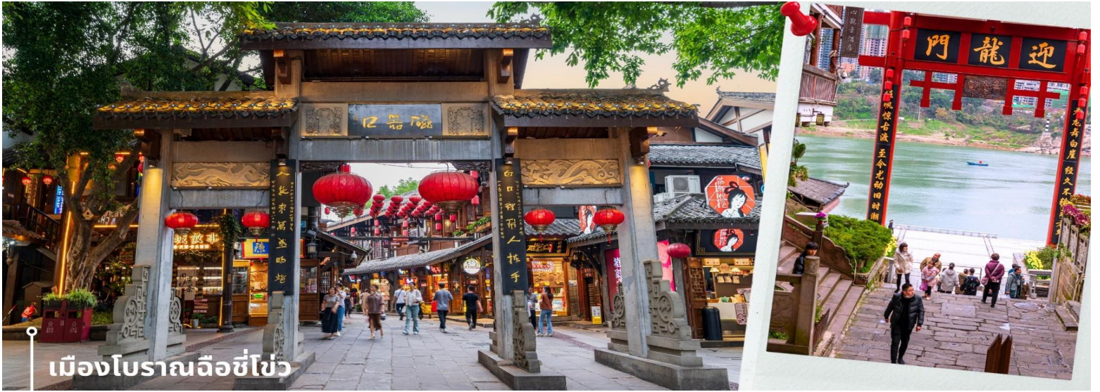
เมืองโบราณฉือโข่ว

นำท่านเดินทางสู่ วัดหลัวฮั่น (Luohan Temple) วัดสำนักงานใหญ่พุทธสมาคมแห่งนครฉงชิ่ง เป็นวัดเก่าแก่ที่สุดในฉงชิ่ง (Chongqing) ซึ่งสร้างขึ้นเมื่อ 1,000 ปีก่อน มีประวัติความเป็นมายาวนานเป็นจุดหมายทางศาสนาและเป็นศูนย์กลางของชาวพุทธในภูมิภาคการท่องเที่ยวที่สำคัญของภูมิภาค และเป็นแหล่งเรียนรู้ที่สำคัญของศิลปวัฒนธรรมจีน วัดนี้ประดิษฐานพระอรหันต์ถึง 500 องค์ แต่ละองค์มีลักษณะ ท่าทาง และสีหน้าแตกต่างกัน มีสถาปัตยกรรมแบบจีนโบราณที่สวยงามและละเอียดอ่อน พระอรหันต์ 500 องค์ แกะสลักด้วยหินและไม้ สะท้อนถึงความเชื่อในพุทธศาสนาและมีมือศิลปะจีน