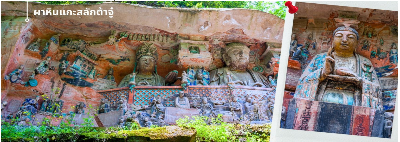
ผาหินแกะสลักถ้ำจูนัน

การแกะสลักถ้ำและผาหิน กลุ่มผาหินแกะสลักถ้ำจูนันมีมากกว่า 70 จุด ซึ่งงานมากกว่า 1 แสนชิ้น ในนั้นถือว่า “เป่าตั้งซาน” และ “เป่ยซานม่อหย่า” สองสถานที่นี้มีหินแกะสลักชิ้นซื่อกมากที่สุด เน้นไปทางพุทธศาสนาเป็นแบบอย่างของถ้ำหินแกะสลักของประเทศจีนในยุคศิลปะตอนปลาย และ หินแกะสลักเป่าตั้งซาน เป็นตัวหลักในการขุดเจาะแกะสลักอย่างยากลำบากกว่า 70 กว่าปี หินแกะสลักที่นี้จะแกะตามรูปลักษณะของตัวภูเขา ด้วยความปราณีต และพิถีพิถัน มีความสวยงามเพียบพร้อมด้วยเนื้อหาบอกเล่าและเตือนสติผู้พบเห็น และยังมี การจัดแบ่งงานฝีมือของแต่ละยุคไว้ เป็นการประชันของช่างในแต่ละยุค ด้านใต้จะเป็นงานในยุคถึงตอนปลาย จนถึง ยุคห้ารัชกาล และ ด้านเหนือจะเป็นงานในสมัย ช่งเหนือซึ่งได้ ซึ่งงานฝีมือในแต่ละยุคจะสะท้อนความเป็นอยู่และค่านิยมที่ไม่เหมือนกัน