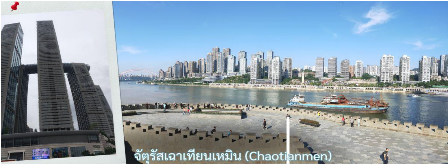
จัตุรัสเฉาเทียนเหมิน (Chaotianmen)

จากนั้น นำท่านเดินทางสู่ จัตุรัสเฉาเทียนเหมิน ซึ่งตั้งอยู่ ณ จุดบรรจบของ แม่น้ำแยงซี และ แม่น้ำเจียหลิง นับเป็นท่าเรือขนส่งทางน้ำที่ใหญ่ที่สุดของนครฉงชิ่ง และเป็นศูนย์กลางการค้าสำคัญมาอย่างยาวนาน บริเวณนี้ยังเป็นที่ตั้งของ ตลาดการค้าครบวงจรเฉาเทียนเหมิน ซึ่งถือเป็นตลาดขนาดใหญ่ที่สุดของฉงชิ่ง ทำให้พื้นที่โดยรอบเต็มไปด้วยผู้คนและมีชีวิตชีวาอยู่เสมอ ตั้งแต่อดีตจนถึงปัจจุบัน จัตุรัสแห่งนี้ได้รับการออกแบบให้มีลักษณะคล้ายเรือยักษ์ที่กำลังแล่นออกสู่สายน้ำอย่างสง่างาม จึงได้รับสมญานามว่า “โททานิคแห่งฉงชิ่ง” เมื่อยืนอยู่บนจัตุรัส ท่านจะสามารถมองเห็นภาพอันน่าประทับใจของจุดบรรจบระหว่างแม่น้ำสองสาย โดยน้ำสีเหลืองของแม่น้ำแยงซีและน้ำสีเขียวมรกตของแม่น้ำเจียหลิงไหลมาบรรจบกันอย่างชัดเจน สร้างทัศนียภาพที่สวยงามและเป็นเอกลักษณ์ของฉงชิ่งอย่างแท้จริง