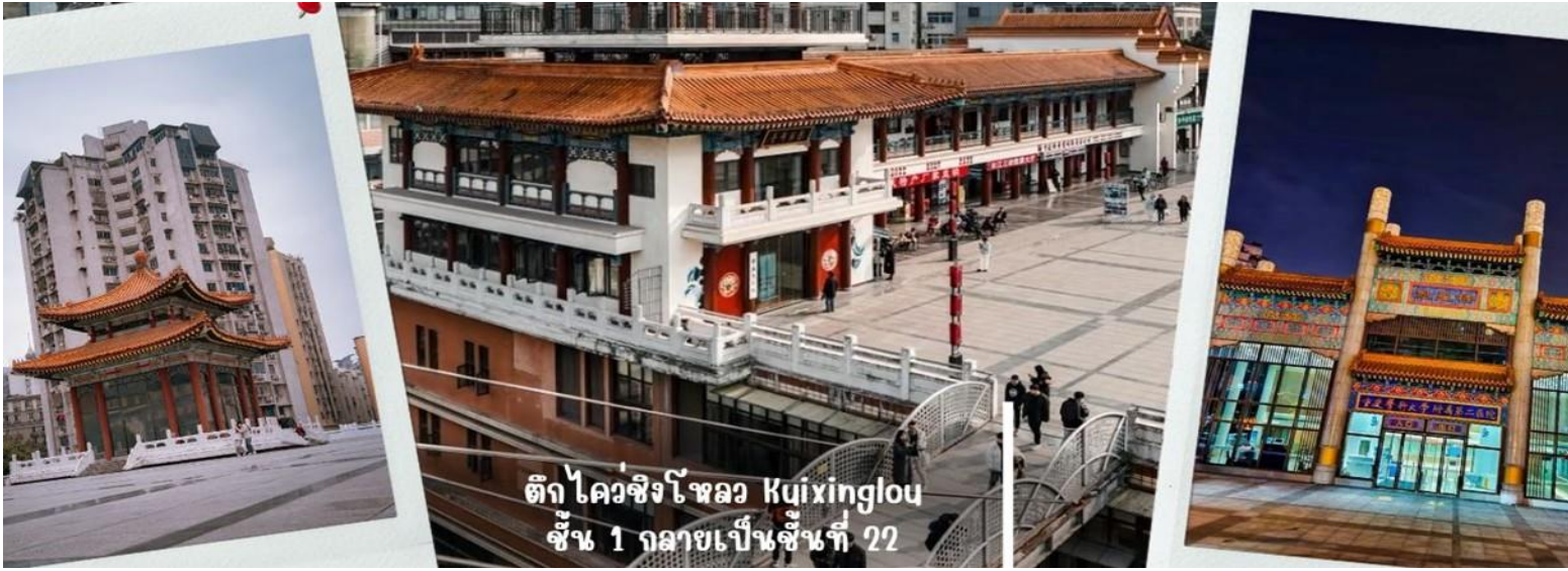
ตึก ไควซิงโหลว Kuixinglou ชั้น 1 กลายเป็นชั้นที่ 22

จากนั้น นำท่านเดินทางสู่ จัตุรัสเฉาเทียนเหมิน ซึ่งตั้งอยู่ ณ จุดบรรจบของ แม่น้ำแยงซี และ แม่น้ำเจียหลิง นับเป็นท่าเรือขนส่งทางน้ำที่ใหญ่ที่สุดของนครฉงชิ่ง และเป็นศูนย์กลางการค้าสำคัญมาอย่างยาวนาน บริเวณนี้ยังเป็นที่ตั้งของ ตลาดการค้าครบวงจรเฉาเทียนเหมิน ซึ่งถือเป็นตลาดขนาดใหญ่ที่สุดของฉงชิ่ง ทำให้พื้นที่โดยรอบเต็มไปด้วยผู้คนและมีชีวิตชีวาอยู่เสมอ ตั้งแต่อดีตจนถึงปัจจุบัน จัตุรัสแห่งนี้ได้รับการออกแบบให้มีลักษณะคล้ายเรือยักษ์ที่กำลังแล่นออกสู่สายน้ำอย่างสง่างาม จึงได้รับสมญานามว่า “โททานิคแห่งฉงชิ่ง” เมื่อยืนอยู่บนจัตุรัส ท่านจะสามารถมองเห็นภาพอันน่าประทับใจของจุดบรรจบระหว่างแม่น้ำสองสาย โดยน้ำสีเหลืองของแม่น้ำแยงซีและน้ำสีเขียวมรกตของแม่น้ำเจียหลิงไหลมาบรรจบกันอย่างชัดเจน สร้างทัศนียภาพที่สวยงามและเป็นเอกลักษณ์ของฉงชิ่งอย่างแท้จริง