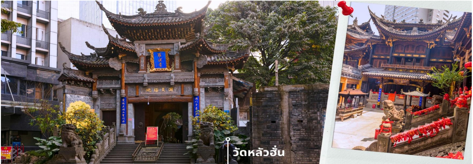
วัดหลัวฮั่น

นำท่านเดินทางสู่ วัดหลัวฮั่น (Luohan Temple) วัดสำนักงานใหญ่พุทธสมาคมแห่งนครฉงชิ่ง เป็นวัดเก่าแก่ที่สุดในฉงชิ่ง (Chongqing) ซึ่งสร้างขึ้นเมื่อ 1,000 ปีก่อน มีประวัติความเป็นมายาวนานเป็นจุดหมายทางศาสนาและเป็นศูนย์กลางของชาวพุทธในภูมิภาคการท่องเที่ยวที่สำคัญของภูมิภาค และเป็นแหล่งเรียนรู้ที่สำคัญของศิลปวัฒนธรรมจีน วัดนี้ประดิษฐานพระอรหันต์ถึง 500 องค์ แต่ละองค์มีลักษณะ ท่าทาง และสีหน้าแตกต่างกัน มีสถาปัตยกรรมแบบจีนโบราณที่สวยงามและละเอียดอ่อน พระอรหันต์ 500 องค์ แกะสลักด้วยหินและไม้ สะท้อนถึงความเชื่อในพุทธศาสนาและมีมือศิลปะจีน