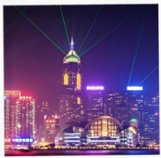
SYMPHONY OF LIGHT