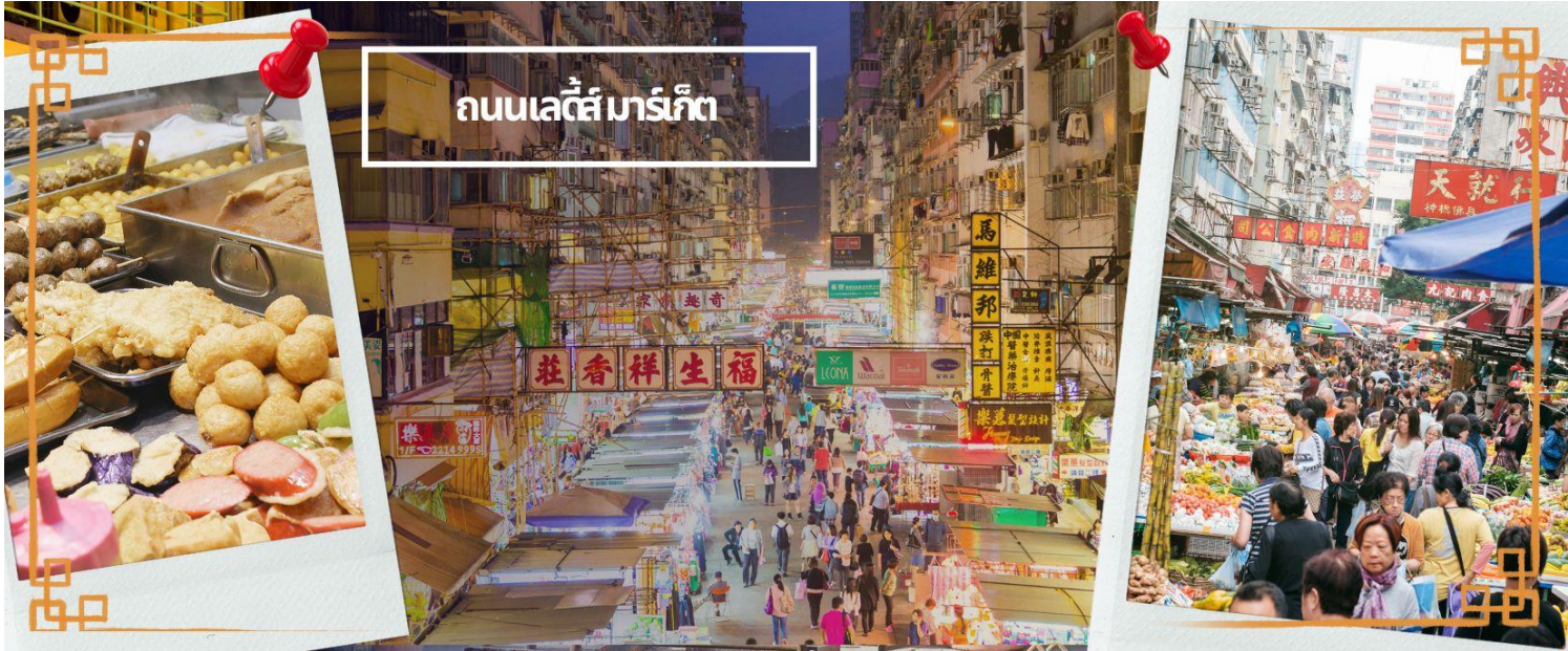
ถนนเลดี้มาร์เก็ต

โทรศัพท์ : 042-246662 / 086-4515274 E-mail : journeyticket@hotmail.com