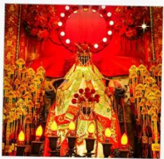
เจ้าแม่กวนอิมสองห้า