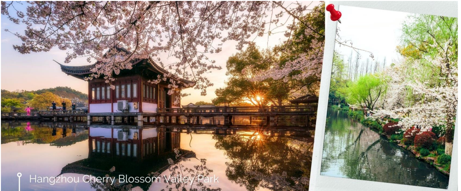
Hangzhou Cherry Blossom Valley Park

วันที่ 10 มีนาคมของทุกปี ในขณะที่ดอกซากุระช่วงปลายจะบานตั้งแต่เดือนเมษายนถึงกลางเดือนพฤษภาคม ดังนั้น