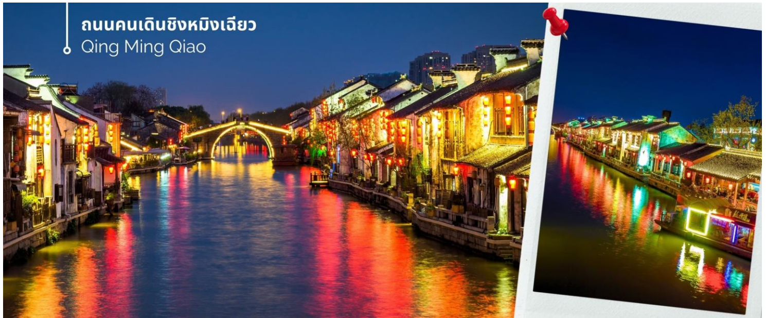
ถนนคนเดินชิงหมิงเฉียว Qing Ming Qiao

จากนั้นให้ท่านเดินชมบรรยากาศพื้นเมืองโบราณของ ถนนคนเดินชิงหมิงเฉียว เราจะได้เห็นบรรยากาศ บ้านเรือน สไตล์จีนโบราณ ร้านค้าต่างๆ ที่ขายสินค้าพื้นเมือง เสื้อผ้า ขนม ของประดับตกแต่ง ของฝาก ของที่ระลึกสวยๆ ให้เดิน ดูกันอย่างเพลิดเพลิน