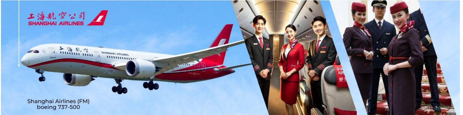
Shanghai Airlines (FM) boeing 737-500

06.30 น. พร้อมกันที่ ท่าอากาศยานสุวรรณภูมิ ณ อาคารผู้โดยสารขาออก (ระหว่างประเทศ) ชั้น 4 เคาน์เตอร์ U สายการบิน