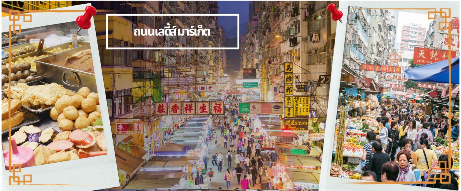
ถนนเลดี้มาร์เก็ต

โทรศัพท์ : 042-246662 / 086-4515274 E-mail : journeyticket@hotmail.com