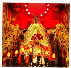
เจ้าแม่กวนอิมสองฮ่า