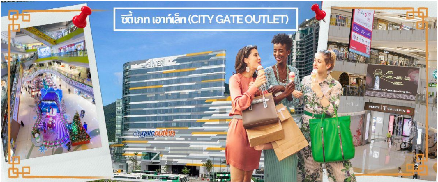
ซิตี้เกต เอาท์เล็ต (CITY GATE OUTLET)

โทรศัพท์ : 042-246662 / 086-4515274 E-mail : journeyticket@hotmail.com