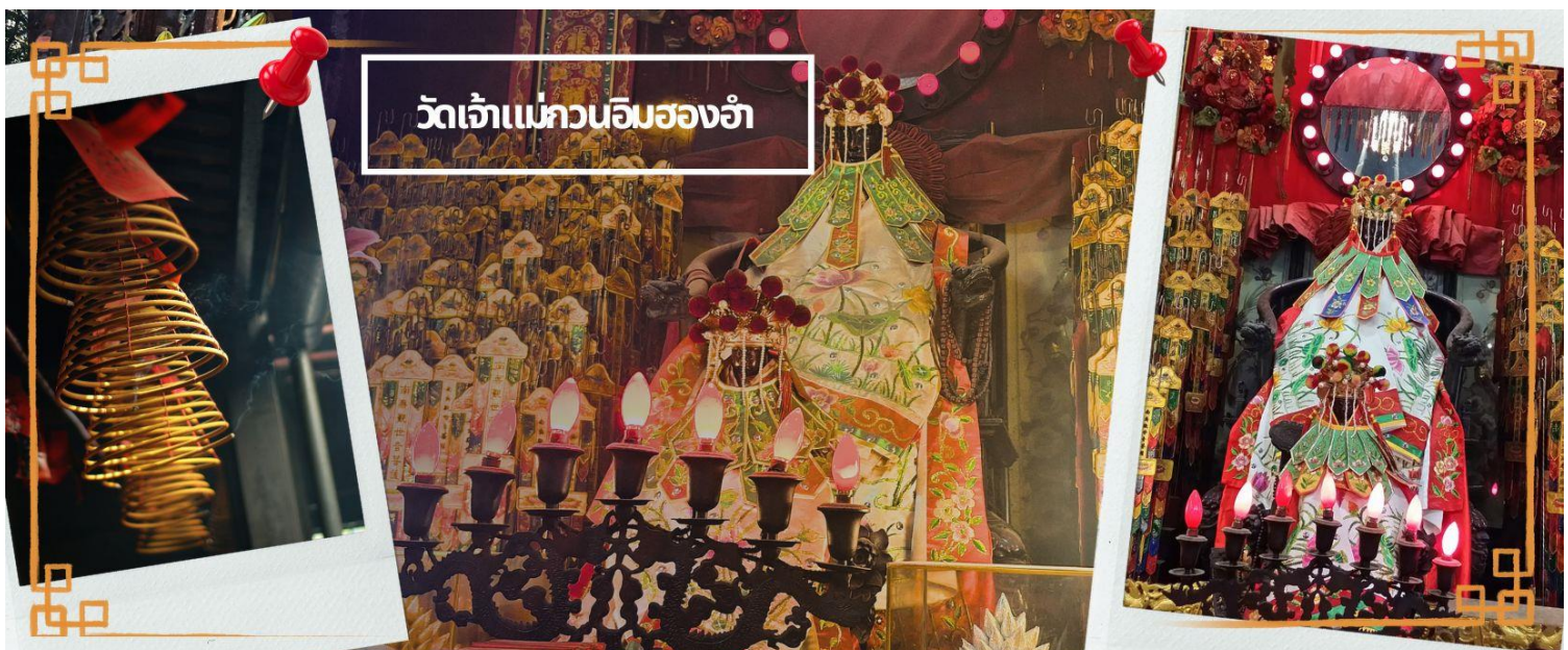
วัดเจ้าแม่กวนอิมสองฮ่า

เช้า 10! บริการอาหารเช้า ณ ภัตตาคาร **เมนูเต็มเช้าต้นตำหรับฮ่องกง** (4) จากนั้นนำทุกท่านเดินทางสู่ วัดเจ้าแม่กวนอิมสองฮ่า (HUNG HOM KWUN YUM TEMPLE) เป็นหนึ่งในวัดที่ ชาวฮ่องกงนั้นเลื่อมใสกันมาก ด้วยความที่เจ้าแม่กวนอิมนั้นเป็นเทพเจ้าแห่งความเมตตา ฉะนั้นเมื่อใครมีทุกข์ ร้อนอะไรก็มักจะมากกราบไหว้ขอพรให้เจ้าแม่ช่วยเหลือ วัดนี้ถูกสร้างขึ้นในปี ค.ศ. 1873 ในช่วงสงครามโลก