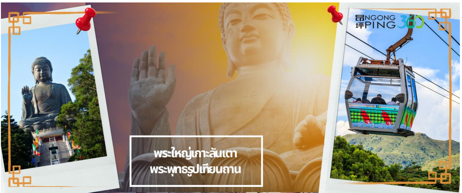
พระใหญ่เกาะลันเตา พระพุทธรูปเทียนถาน

เทียนถาน (TIAN TAN BUDDHA STATUE) ที่ตั้งตระหง่านอยู่บริเวณริมหน้าผา เป็นพระพุทธรูปทองสัมฤทธิ์ กลางแจ้งที่ใหญ่ที่สุดในโลก องค์พระทำขึ้นจากการเชื่อมแผ่นทองสัมฤทธิ์กว่า 200 แผ่น เข้าด้วยกัน น้ำหนัก รวม 250 ตัน และสูง 34 เมตร หันพระพักตร์ไปทางด้านทะเลจีนใต้ และมองอย่างสงบลงมายังหุบเขาและโขด หินเบื้องล่างซึ่ง และเชิญท่านอิสระตามอัธยาศัย ลิ้มลองความอร่อยของ อาหารจีนต้นตำรับเมนู อาหารตะวันตก ชั้นเลิศ หรือจะนั่งจิบกาแฟเอ็กซ์เพรสโซอันหอมกรุ่น จากร้านอาหารและร้านค้ากาแฟในหมู่บ้านนองปิง หรือบาง ท่านอาจจะเลือกซื้อของขวัญของที่ระลึกจากหมู่บ้านนองปิง อาทิเช่น หยก ไข่มุก หรือเครื่องประดับคริสตัล เพื่อ เป็นของที่ระลึก จากนั้นนั่งกระเช้ากลับลงมายังสถานีตุงชุง