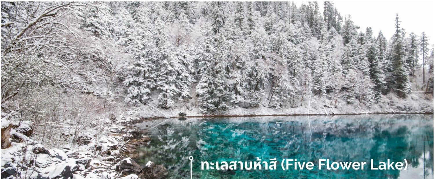
ทะเลสาบห้าสี (Five Flower Lake)

หนึ่งในจุดที่สวยงามและนักท่องเที่ยวแวะมาเยี่ยมชมเยอะที่สุด ตั้งอยู่ที่ความสูงเหนือระดับน้ำทะเลประมาณ 2,472 เมตร น้ำลึกประมาณ 5 เมตร น้ำใสจนเห็นพื้นด้านล่างของทะเลสาบ สีของผิวน้ำสวยงามแปลกตา โดยเฉพาะเมื่อยามแสงอาทิตย์สาดส่องกระทบผิวน้ำ สีของน้ำในทะเลสาบจะสะท้อนเป็นสีส้มถึง 5 เฉดสี สวยงามสะกดตา ซึ่งสาเหตุที่ทำให้