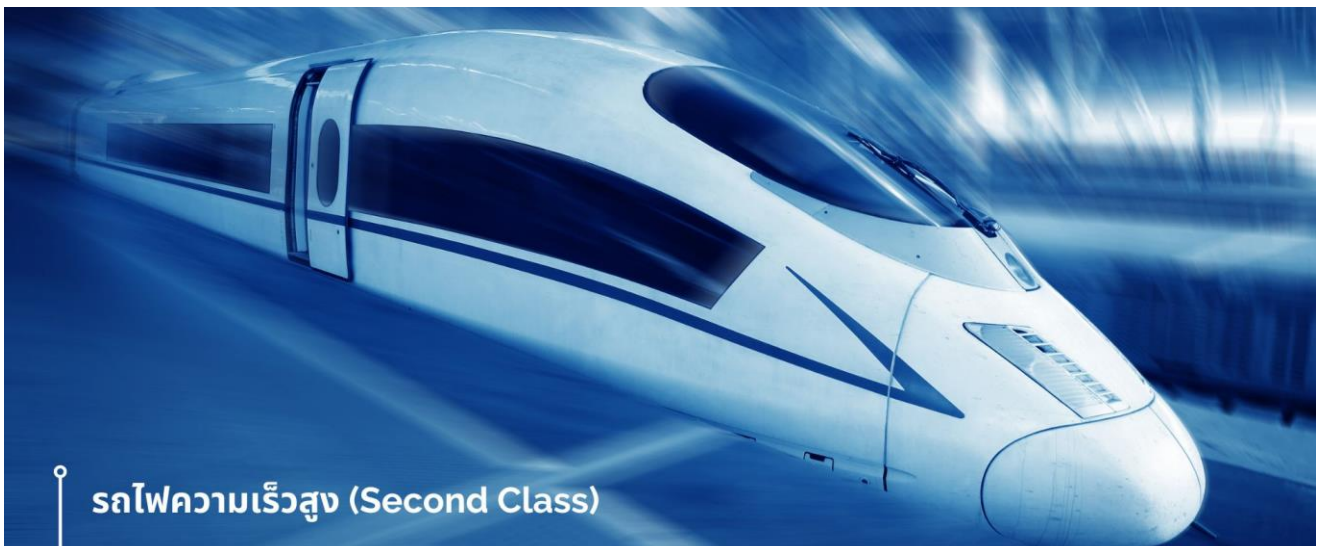
รถไฟความเร็วสูง (Second Class)