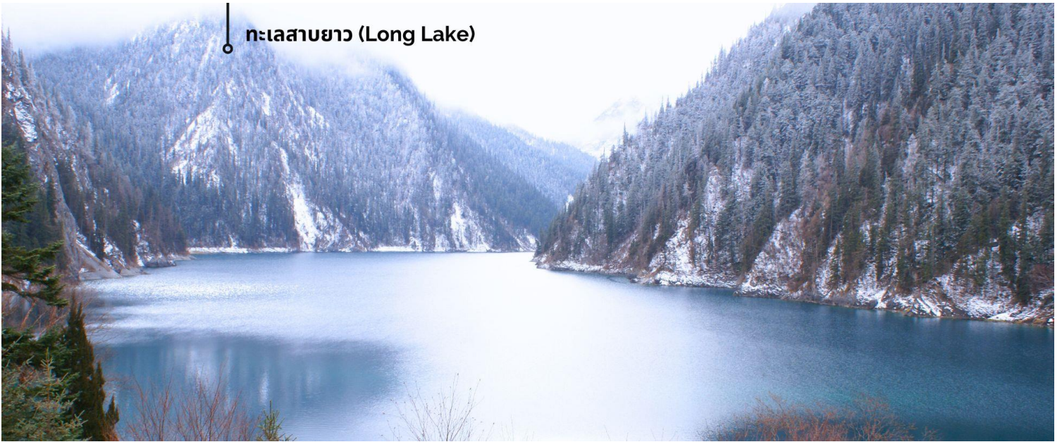
ทะเลสาบยาว (Long Lake)

ทะเลสาบที่ใหญ่ที่สุด สูงที่สุด และลึกที่สุดในจังหวัดเลย ด้วยเนื้อที่กว่า 581 ไร่ ความยาวกว่า 7 กิโลเมตร และลึกถึง 103 เมตร ทอดตัวโค้งเป็นรูปพระจันทร์เสี้ยว เนื่องจากหิมะบนภูเขาละลายลงมา น้ำในทะเลสาบสีฟ้าสวยงาม ล้อมรอบด้วยยอดเขาสูงชัน และต้นไม้ใหญ่ที่ปกคลุมด้วยหิมะ งดงามราวหลุดออกมาจากภาพวาด ความพิเศษในช่วงฤดูหนาว ทะเลสาบจะกลายเป็นน้ำแข็งหนากว่า 60 เซนติเมตร ทำให้นักท่องเที่ยวนิยมมาเล่นสกีตน้ำแข็งกันเป็นจำนวนมาก