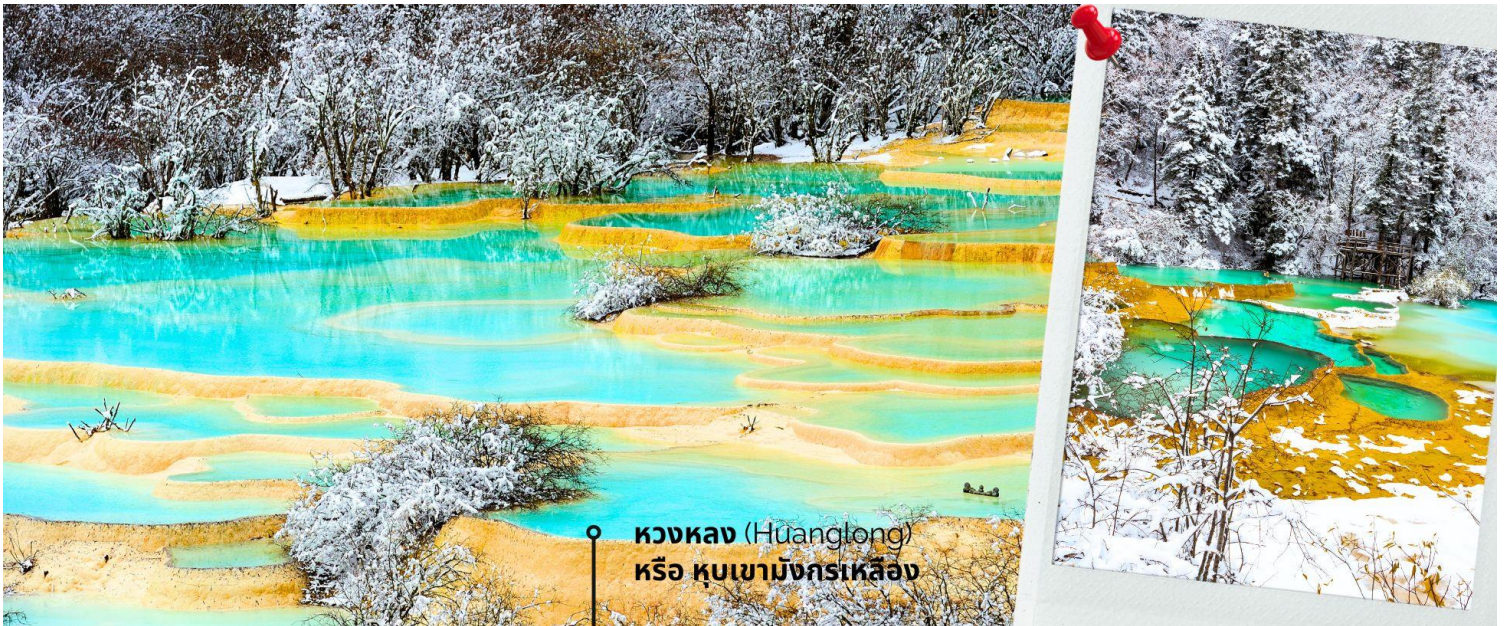
หวงหลง (Huanglong) หรือ หุบเขามังกรเหลือง

หวงหลง (Huanglong) หรือ หุบเขามังกรเหลือง (รวมค่ากระเช้าขึ้น-ลง หวงหลงและรถเบตเตอร์) ที่ได้รับการขึ้นทะเบียนเป็นมรดกโลก รายล้อมไปด้วยแอ่งน้ำสีฟ้าจำนวนมากไม่ถ้วน และภูเขาสูงใหญ่สลับซับซ้อน อุทยานหวงหลง (Huanglong Scenic and Historic Interest Area) หรือ หุบเขามังกรเหลือง แหล่งธรรมชาติที่อุดมสมบูรณ์บนเทือกเขา Minshan Mountains มีระบบนิเวศที่หลากหลาย ทั้งน้ำพุร้อน น้ำตก แอ่งน้ำหินปูน รวมถึงเป็นแหล่งของพืชพรรณนานาชนิด และสัตว์ป่าใกล้สูญพันธุ์อย่าง แพนด้ายักษ์ และ ลิงจุกเขดสีทอง เป็นต้น ที่สำคัญยังมีทัศนียภาพที่สวยงามที่ราวกับเป็นดินแดนสวรรค์ ด้วยคุณสมบัติเหล่านี้ อุทยานหวงหลงจึงได้รับการขึ้นทะเบียนเป็นมรดกโลกโดย