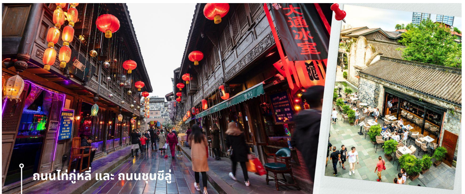
ถนนไถ่กุหลี่ และ ถนนซุนซีลู่

จากนั้นให้ท่านให้อิสระกับการเลือกซื้อสินค้าของฝากที่ ถนนไถ่กุหลี่ และ ถนนซุนซีลู่ ในย่านนี้เป็นถนนโบราณ ในอดีตเคยโรงงานผลิตผ้าไหมใหญ่ที่สุดในจีน ปัจจุบันได้เปลี่ยนเป็นถนนช้อปปิ้งแหล่งสวรรค์ของนักท่องเที่ยว เป็นถนนคนเดิน มีห้างสรรพสินค้าชื่อดัง มีร้านค้ามากกว่า 700 ร้านค้าที่เต็มไปด้วยสินค้าต่าง ๆ ทั้งร้านค้าแฟชั่น ร้านอาหารและโรงแรมนานาชาติมากมายซึ่งเป็นที่เที่ยวเชิงตุ่ที่มีการเชื่อมต่อทางวัฒนธรรมท้องถิ่นที่เป็นแหล่งช้อปปิ้งและเป็นแหล่งร้านอาหารที่อร่อยต่าง ๆ มากมาย ซึ่งเป็นสถานที่เที่ยวของเชิงตุ่ที่ทำให้เพลิดเพลินกับสินค้าแบรนด์เนมและแบรนด์จีน