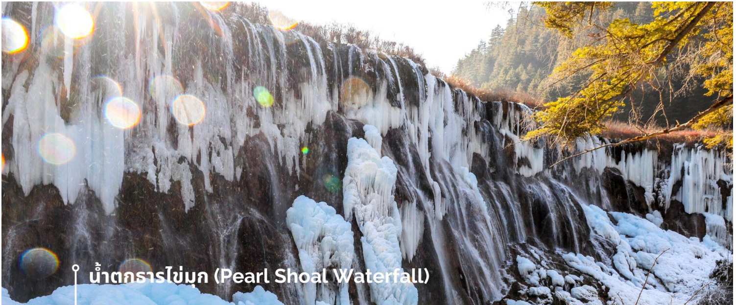
น้ำตกธารไข่มุก (Pearl Shoal Waterfall)

หรือ น้ำตกนูริออลาง (Nuo Ri Lang Waterfall) ถือเป็นน้ำตกที่ใหญ่ที่สุดในจิวจ้ายโกว มีความสูง 40 เมตร กว้าง 310 เมตร เกิดจากหินปูนที่แข็งตัวจนกลายเป็นรูปทรงคล้ายพัด มีสายธารน้อยใหญ่ไหลผ่านลดหลั่นทอดยาวผ่านชั้นหินต่างๆ ยามมีแสงแดดส่องตกลงกระทบผิวน้ำจะส่องประกายราวกับเส้นไข่มุกเหมือนชื่อน้ำตก บางครั้งอาจได้เห็นสายรุ้งจากแสงแดดที่สะท้อนกับละอองน้ำอีกด้วย หากได้มาในช่วงฤดูหนาว ก็จะได้เห็นหิมะเกาะตามต้นไม้ โขดหิน และถ้าอากาศหนาวมากๆ น้ำที่น้ำตกก็จะกลายเป็นน้ำแข็ง กลายเป็นประติมากรรมจากธรรมชาติที่สวยงาม