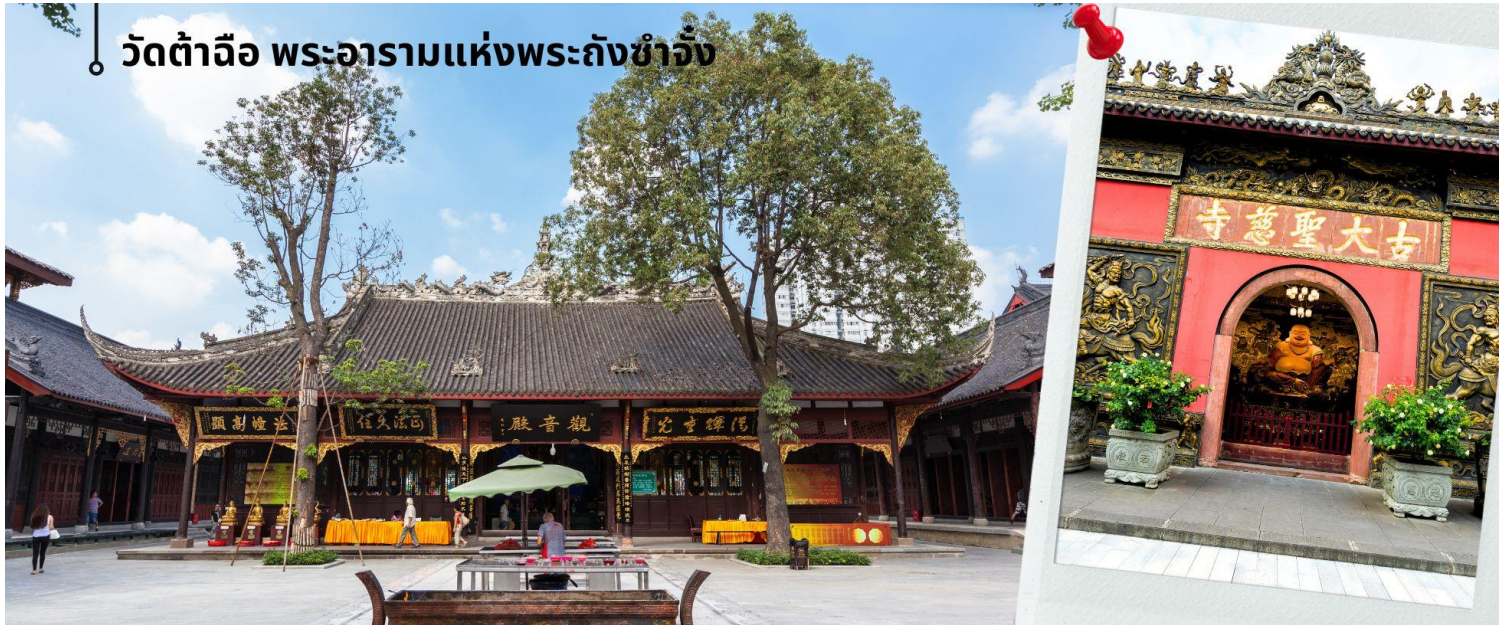
📍 วัดต้าฉือ พระอารามแห่งพระถังซำจั๋ง

นำท่านชม วัดต้าฉือ พระอารามแห่งพระถังซำจั๋ง ใจกลางนครเจิ้งตู พระถังซำจั๋ง ได้รับการสรรเสริญว่าเป็นผู้มีความเพียร และมีชื่อเสียงมายาวนานกว่า 1,400 ปี และยังได้รับการยกย่องว่าเป็น พระไตรปิฎกแห่งราชวงศ์ถัง พุทธประวัติของพระถังซำจั๋งถูกจารึกในสถานที่ต่างๆมากมาย รวมไปถึงได้ถูกกล่าวถึงในจดหมายเหตุหลายเล่ม ตามเส้นทางการเดินทางแห่งความเพียรของท่าน รวมทั้งมีพระอัฐิของท่าน ประดิษฐานอยู่ในพระอารามของนครนานจิง และที่ทะเลสาบสุรียันจันทรเป็นเกาะใต้หวั่นอีกด้วย