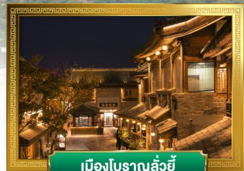
เมืองโบราณลั่วอี้