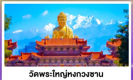
วัดพระใหญ่หรงกวงซาน